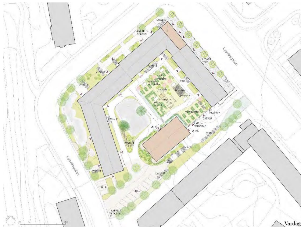
Förslagets situationsplan (beskuren). De båda byggnadstilläggen är markerade med beigetonade rektanglar. Illustrationen är upprättad av Vardag Arkitekter.

I läget för den tänkta nybyggnaden finns idag kuperad terräng, bestående av en modulerad bergsslänt med en brant, organiskt uppkommen gångstig. Den föreslagna planändringen innebär att marken schaktas ut och att berget med tillhörande växtlig försvinner. Den nya byggnaden är högre än den omgivande bebyggelsen, varför den nya byggnaden kommer att skjuta upp ovanför det befintliga taklandskapet.