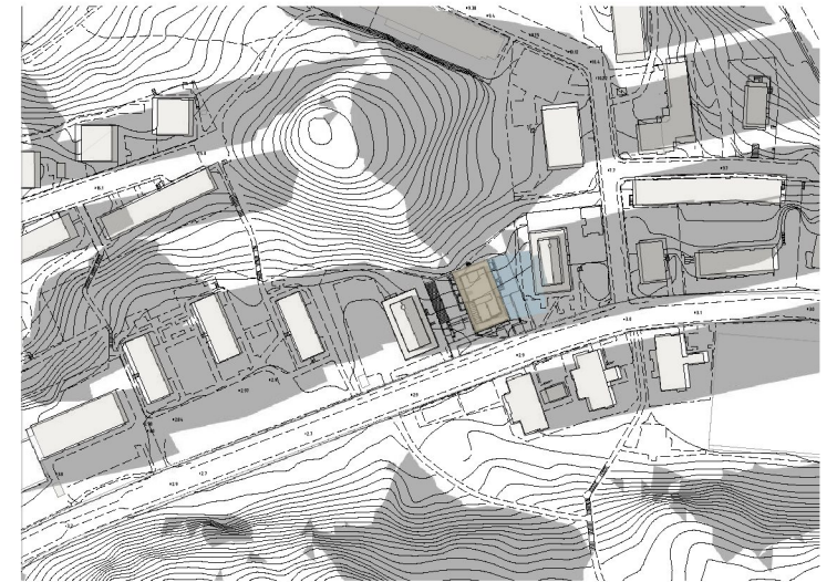
20 mars kl 18.00