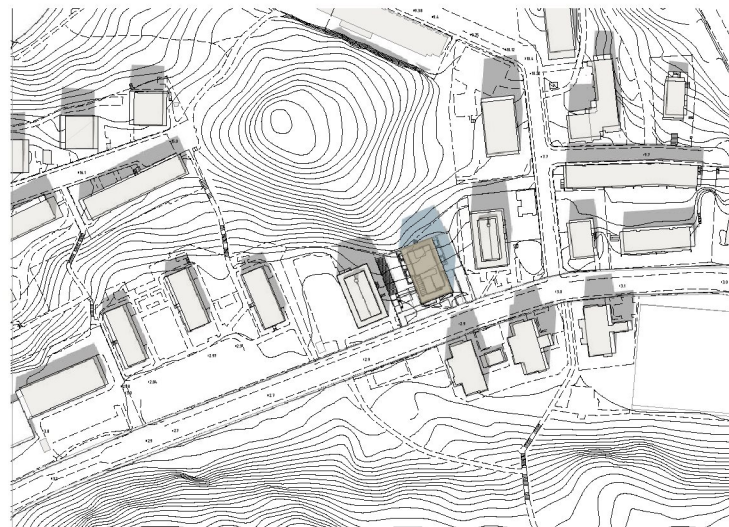
20 juni kl 12.00 10% av östra gården solbelyst 100% av västra gården solbelyst