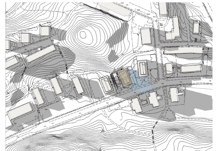
20 juni kl 18.00 10% av östra gården solbelyst 20% av västra gården solbelyst

Godkänt dokument - Tara Nezhadi, Stockholms stadsbyggnadskontor, 2021-02-26, Dnr 2020-03735