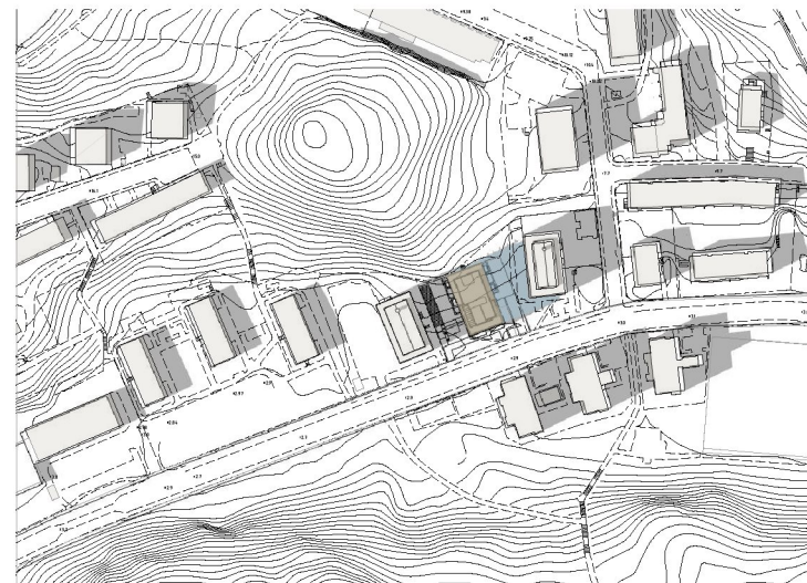
20 juni kl 15.00