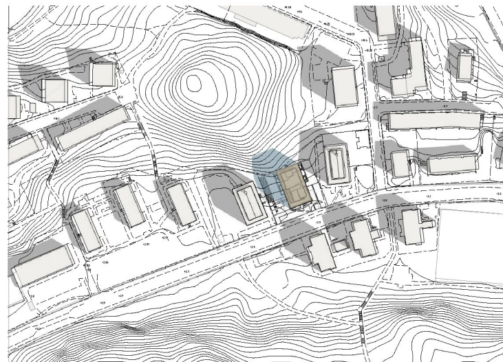
20 juni kl 09.00 50% av östra gården solbelyst 20% av västra gården solbelyst