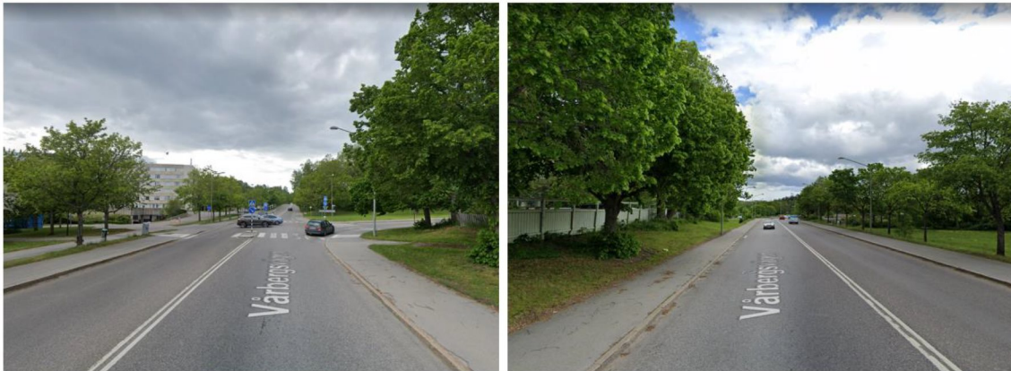
Figur 4 - Till vänster visas sikten västerut och till höger visas sikten österut.

Siktförhållandena vid planerad infart till garaget bedöms efter en översiktlig kontroll vara goda. Figur 4 visar sikten österut respektive västerut.