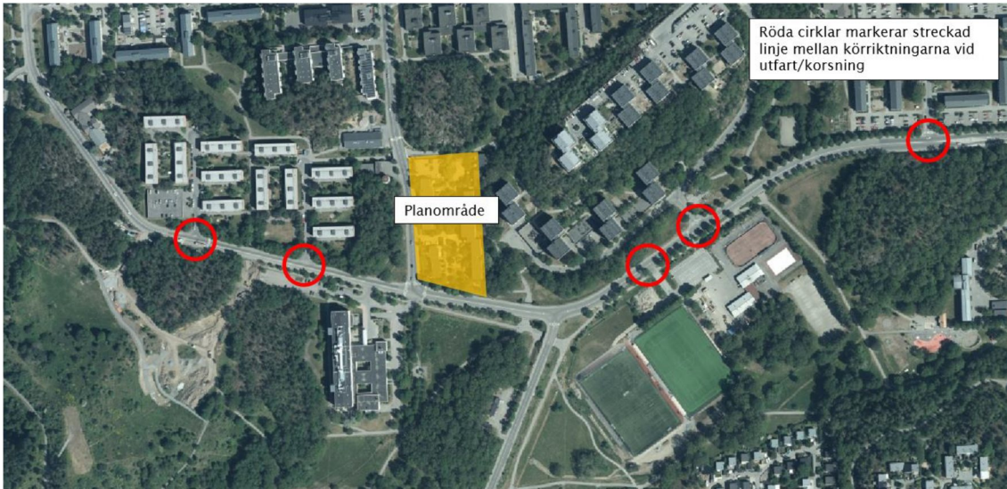
Figur 3 - Exempel på streckade linjer mellan köriktningarna vid utfart/korsning. Observera att detta endast är några exempel längs Vårbergsvägen.

Siktförhållandena vid planerad infart till garaget bedöms efter en översiktlig kontroll vara goda. Figur 4 visar sikten österut respektive västerut.