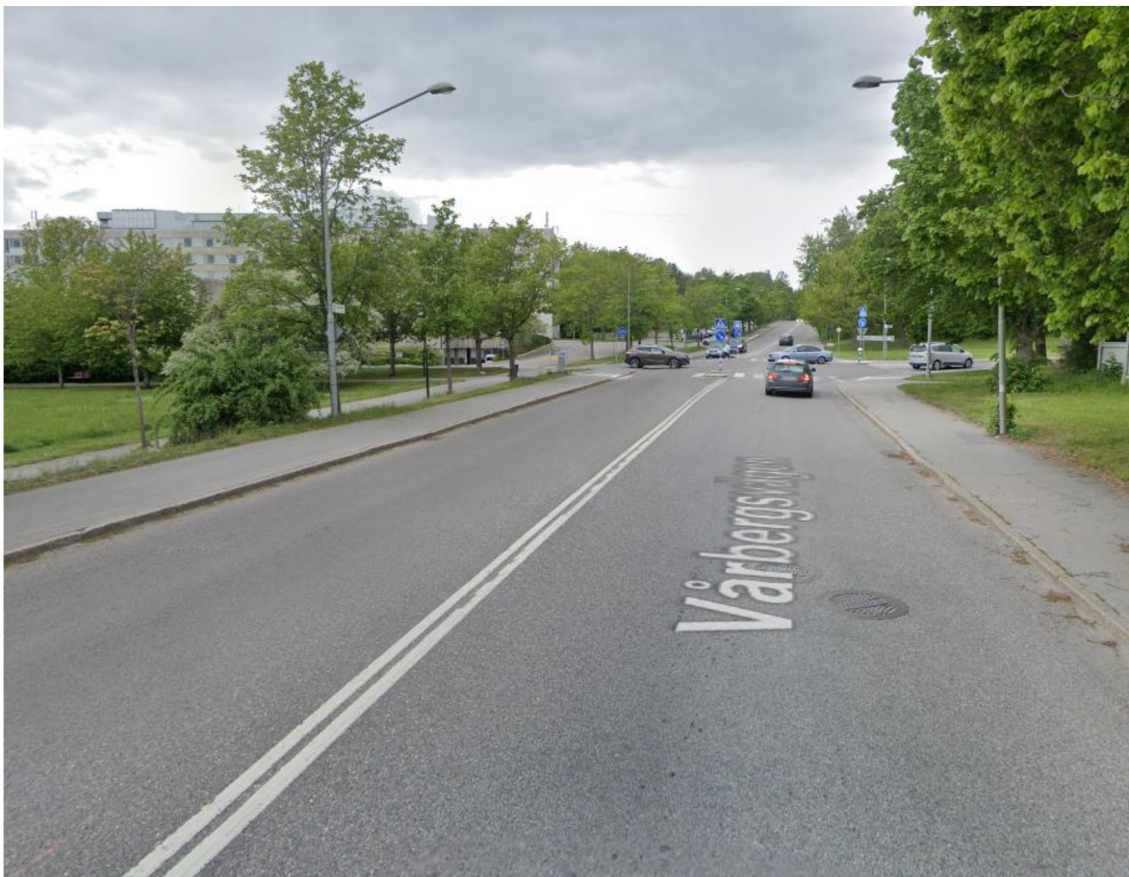
Figur 2 - Heldragen linje skiljer köriktningarna på Vårbergsvägen.

Vårbergsvägen som går söder om planerat parkeringsgarage har en ungefär 10,8 meter bred körbana för motortrafik och 2,5-2,7 meter trottoar på varje sida. Hastighetsgränsen på Vårbergsvägen är 50 km/h. 2014 var dygnstrafiken på Vårbergsvägen ungefär 1800 fordon per dygn. En in- och utfart på norra sidan av Vårbergsvägen innebär korsande av den norra trottoaren, samt korsande av heldragen linje, se figur 2.