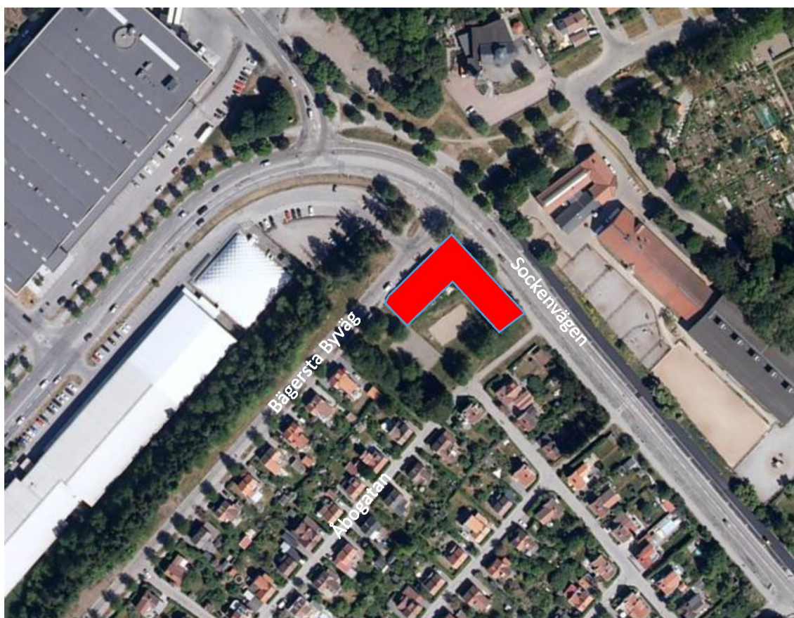
Figur 2-1 Planerad byggnad schematiskt markerade med rött. Bild från Eniro, 2020.

Aktuell fastighet är belägen i södra Stockholm, mellan Enskede Gård och Enskedefältet i hörnet av Sockenvägen och Bägersta Byväg, se Figur 2-1. Fastigheten omges av villor i söder, ett ridhus i öster samt Enskede Rackethall i väster.