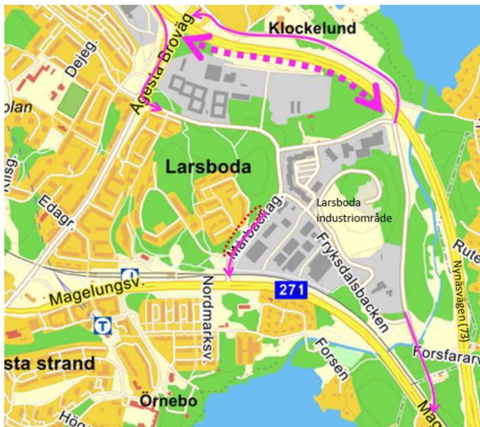
Figur 4.1. Heldragna pilar visar möjliga vägar in och ut ur Larsboda industriområde idag. Bred streckad linje visar en framtida planerad väg in i industriområdet. Aktuellt exploateringsområde är markerat med röd streckad linje. Inom närområdet är det endast Nynäsvägen som är klassad som en transportled för farligt gods.

Beroende på vilka tillkommande verksamheter som planeras inom industriområdet så kan det tillkomma transporter av farligt gods till och från området. Utifrån genomförd kartläggning av befintliga verksamheter samt bedömningen av möjliga framtida verksamheter görs bedömningen att antalet farligt godstransporter till och från verksamheter är relativt begränsat och inte kommer att öka i någon större omfattning vid en utbyggnad av industriområdet. Det bedöms framförallt röra sig om transporter av lösa behållare. Det bedöms inte förekomma några verksamheter som hanterar brandfarliga varor i sådan utsträckning att de genererar stora, frekvent förekommande, farligt godstransporter.