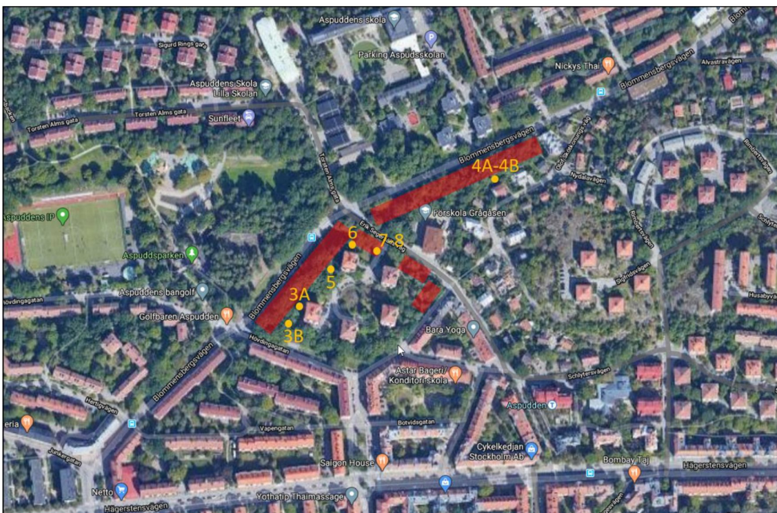
Figur 9. Kartbild som visar var de olika bilderna togs.

Figur 9 nedan visar var de olika bilderna togs.