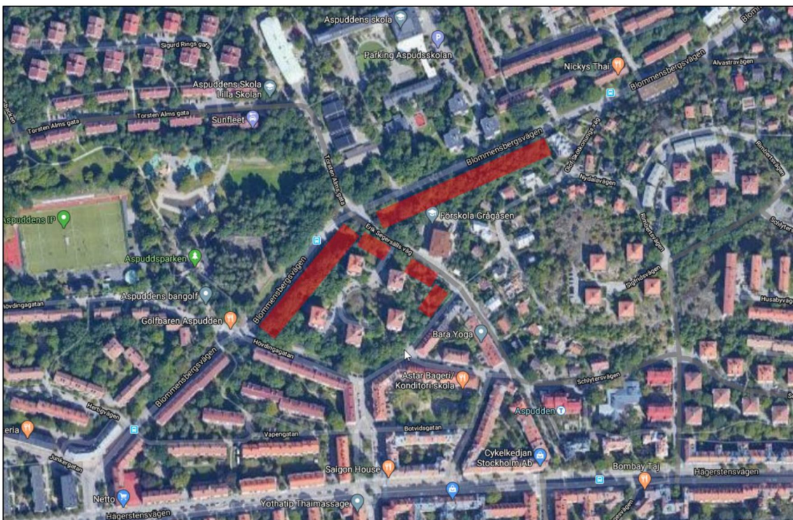
Figur 1. Kartutsnitt från Google Maps 20200615. Undersökningsområdet är markerad med rött.

Ungefärlig utbredning av detaljplaneområdet är markerad med rött i Figur 1.