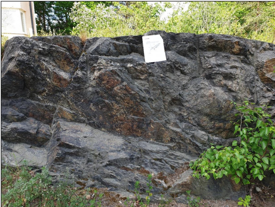
Figur 8. Oxiderade sprickyta vid Sverkersgatan.