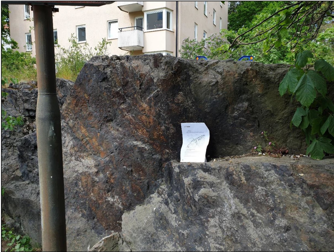
Figur 7. Oxiderade sprickyta vid Sverkersgatan.