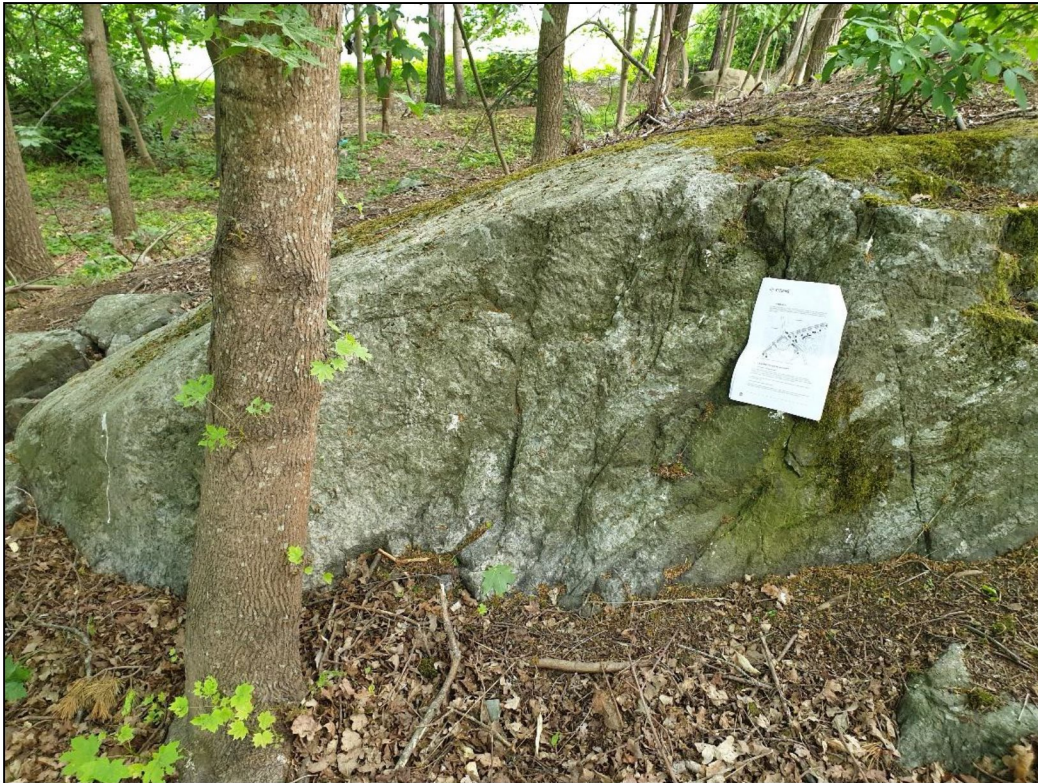
Figur 5. Ej omvandlade och ej oxiderade sprickyta.