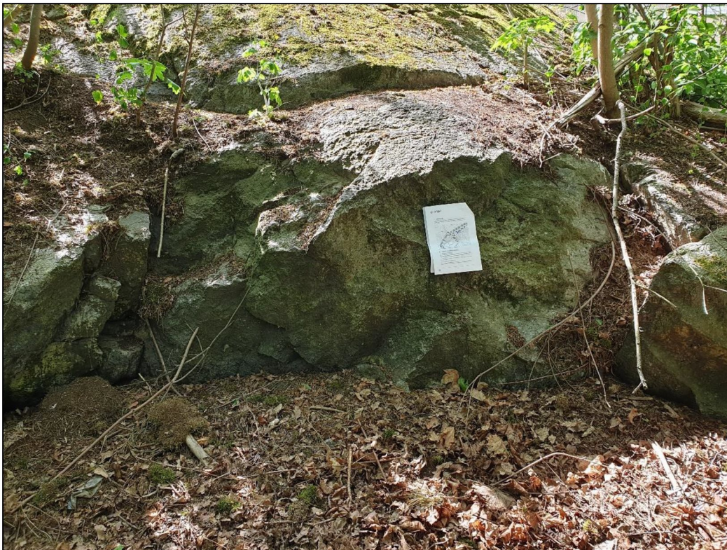
Figur 6. Ej omvandlade och ej oxiderade sprickyta.