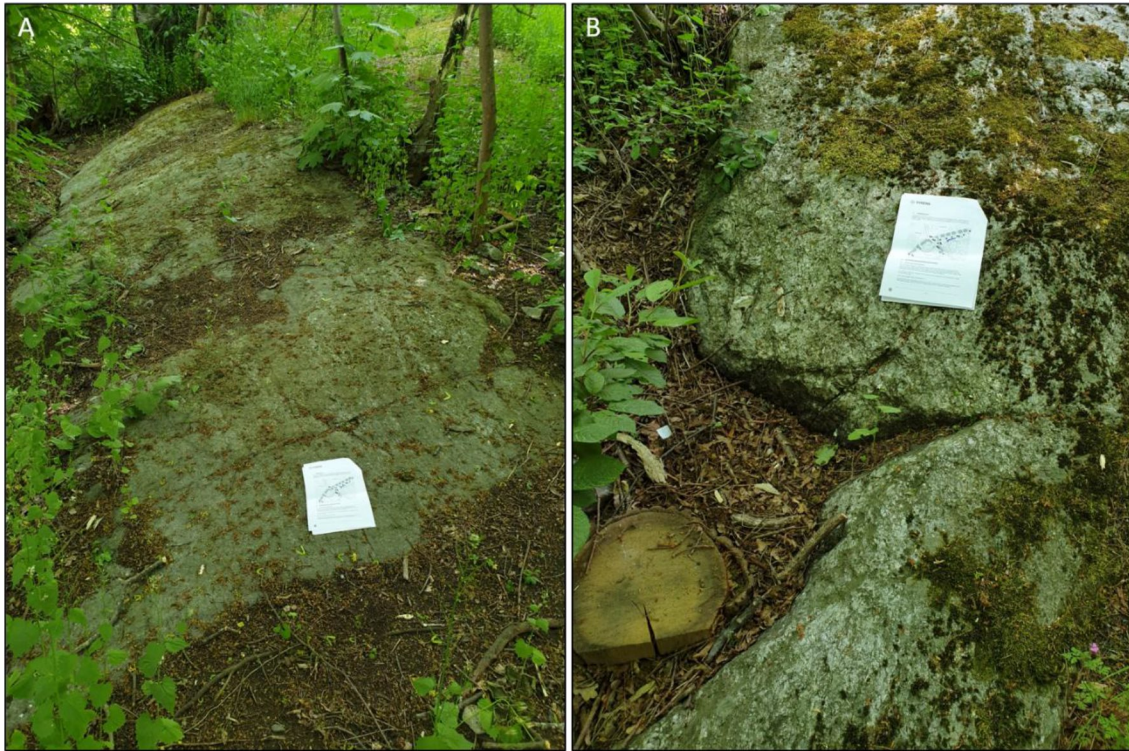
Figur 3. Sedimentgnejs i undersökningsområdet.