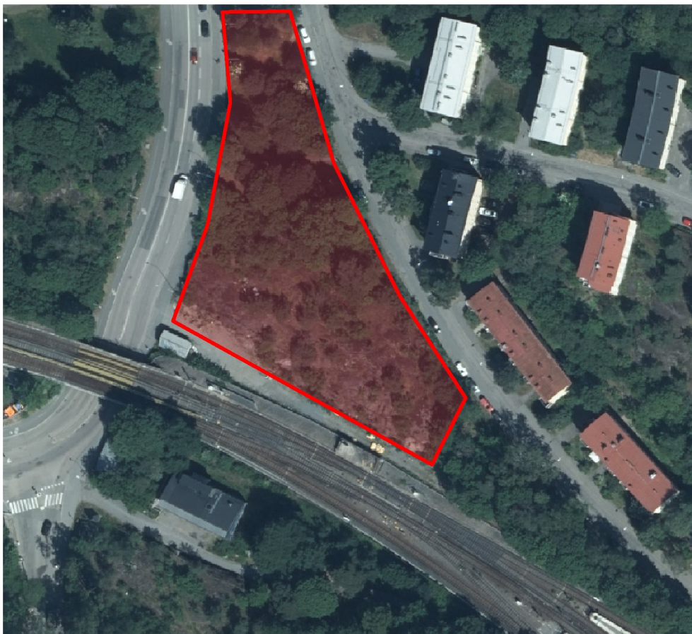
Figur 1 Område för bostäder markerat med rött.

Projektet Cikadan är beläget intill tunnelbanan, mellan stationerna Gullmarsplan och Skärmarbrink. Marken domineras i nuläget av berg i dagen. Mellan berg och tunnelbanan finns en svacka. Tunnelbanan ligger på en banvall, som i höjd är på ungefär samma nivå som berget, se Figur 3.