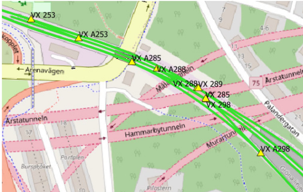
Figur 2 Väcklars matematiska korsningspunkter enligt Trafikförvaltningen

Det finns ett flertal växlar som mellan spåren förbi området. Figur 2 har erhållits från Trafikförvaltningen.