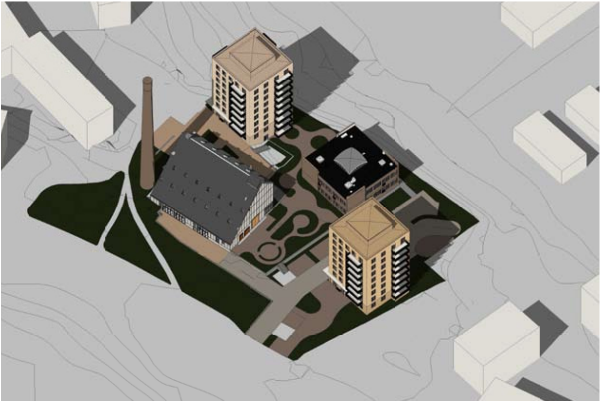
Axonometri över planförslaget. Nyréns arkitektkontor.