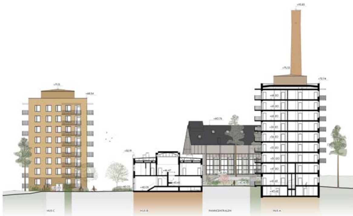
Sektion genom tvättbyggnaden (hus B) och hus A. Nyréns arkitektkontor.