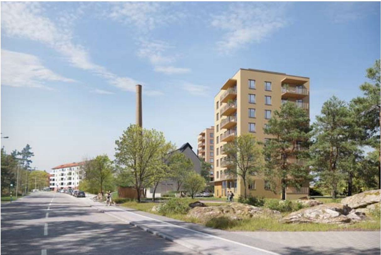
Illustration av planförslaget från Folkparksvägen i söder. Till vänster panncentralen, till höger hus B. Nyréns arkitektkontor.