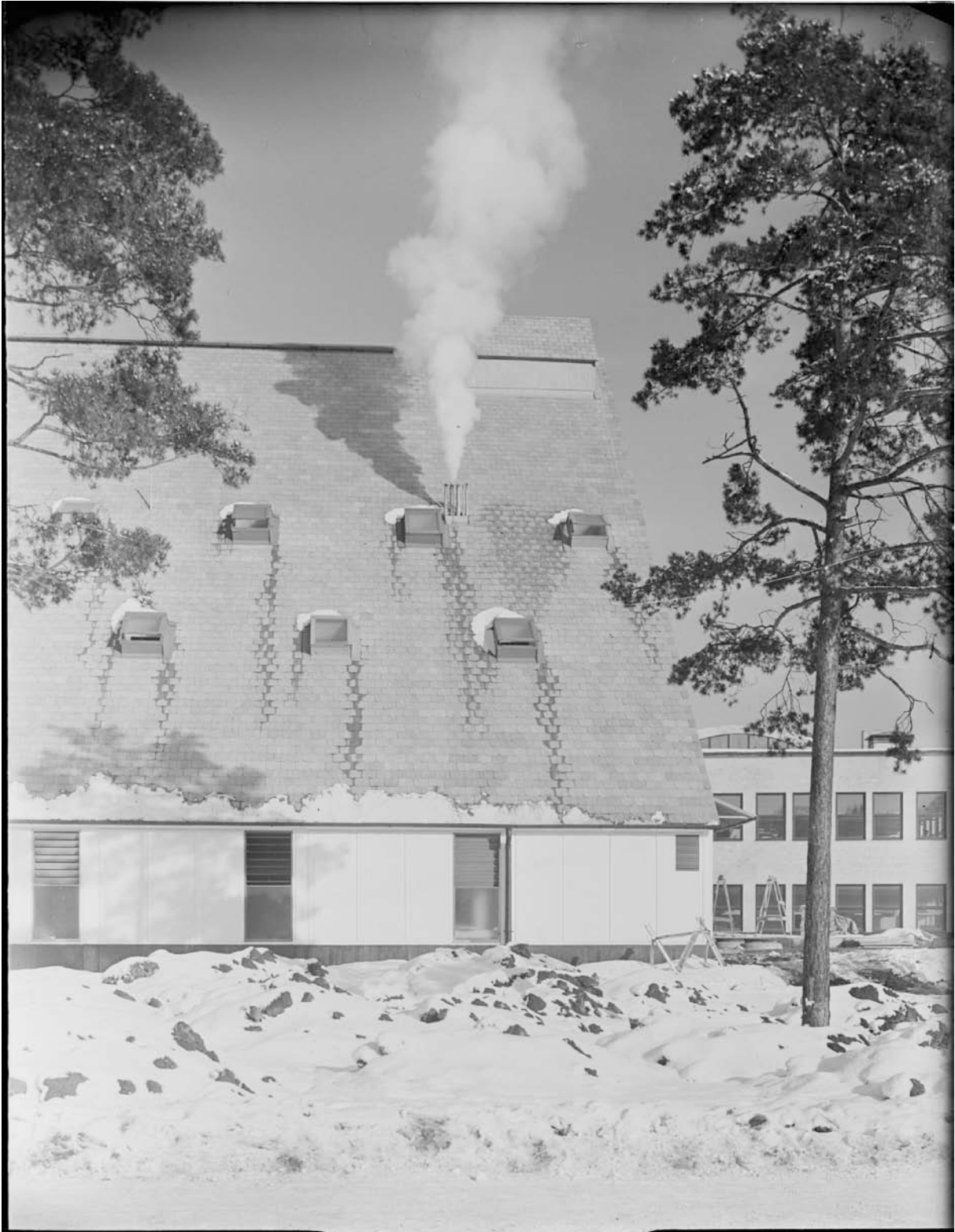
Panncentralen från sydväst 1952, Fasaden är tämligen sluten. De vertikala öppningarna har i nedre halvan en glasruta, och i den övre ett ventilationsgaller. I bakgrunden tvättbyggnaden med ursprunglig färgsättning på fönster i en mörk kulör.