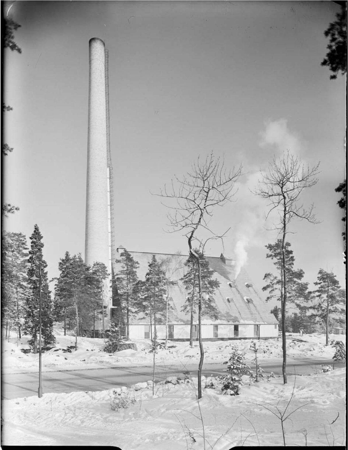
Panncentralen från sydväst 1952, I förgrunden Folkparksvägen.