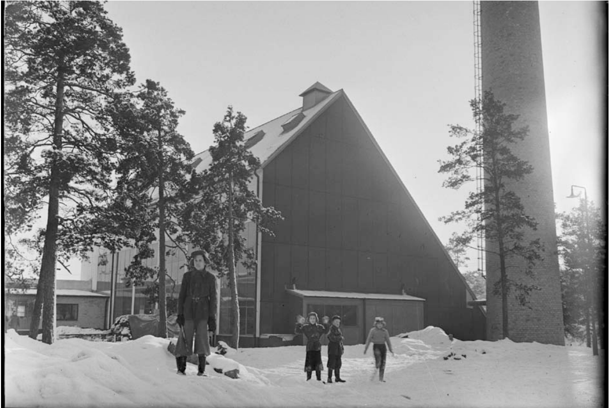
Panncentralen fotograferad vintern 1952. Vy från Kristallvägen i norr. Notera den nästan helt glasade norrfasaden.