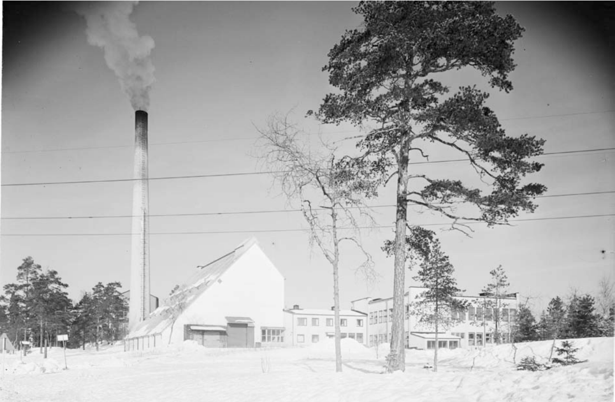
Panncentralen. Förmodligen är anläggningen helt nyuppförd vid fototillfället. Notera det öppna läget vid parkstråket. Detta är numer bebyggt. Notera också avsaknaden av stängsel.