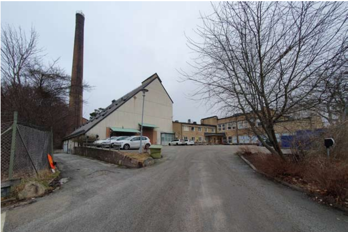
Motsvarande vy idag. Panncentralen har trots de många ändringarna behållt sin huvudsakliga karaktär.