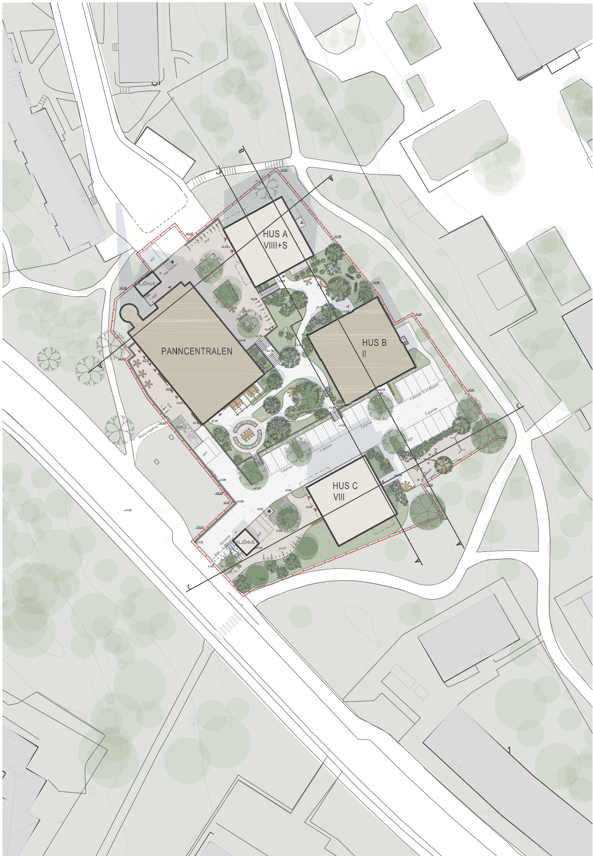
Utsnitt ur p-karta till planförslaget. Nyréns arkitektkontor.