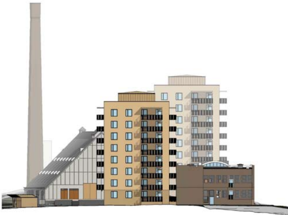
Fasad mot sydost. Nyréns arkitektkontor.