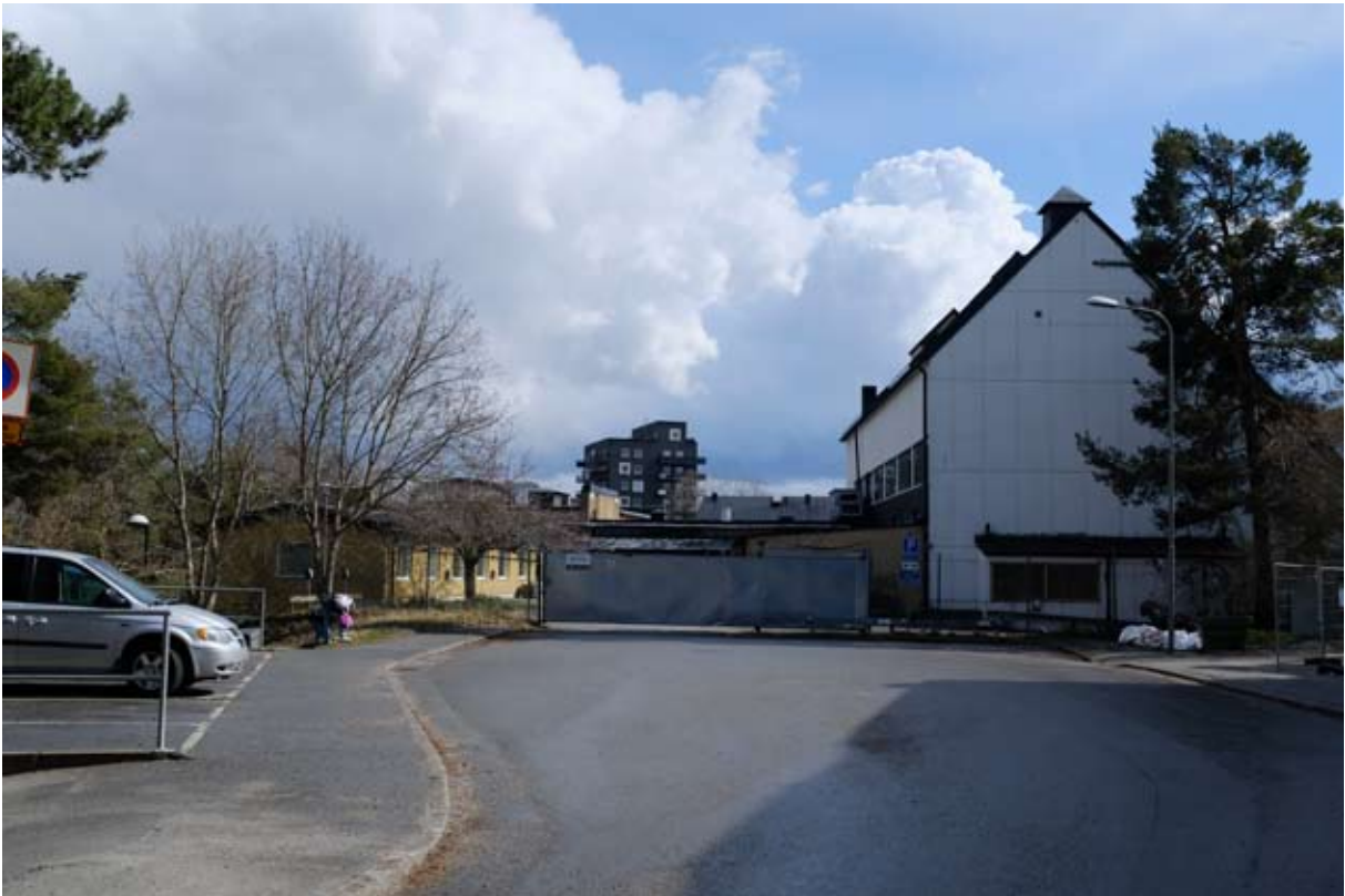
Panncentralen från norr idag. Glasningen har nästan helt byggts bort över tid. Notera tallen till höger i bild som överlevt de 71 åren mellan fototillfällena.