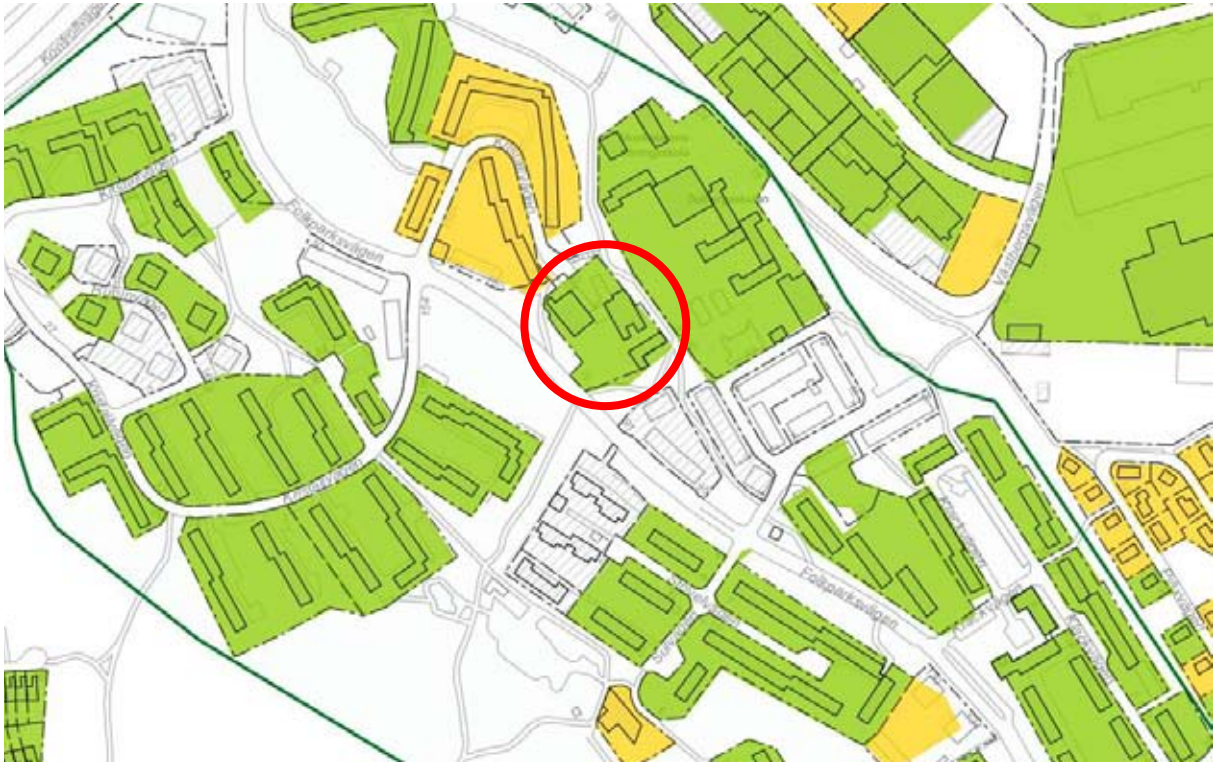
Utsnitt ur Stadsmuseets klassificeringskarta. Planområdet inom röd cirkel. Klassningen görs på fastighetsnivå, och inte som i PBL, på byggnadsnivå. För närmare avvägningar görs därför fördjupade underlag.