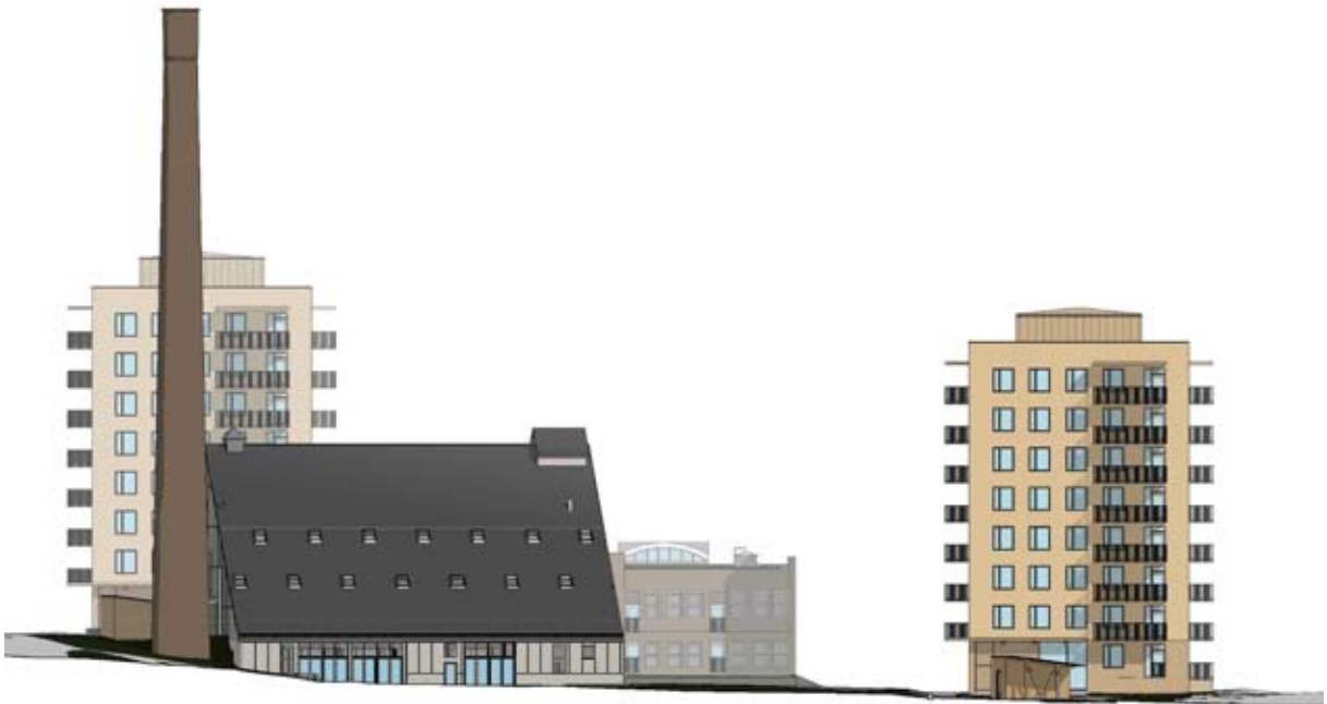
Fasad mot sydväst. Notera de nya öppningarna på panncentralen. Nyréns arkitektkontor.