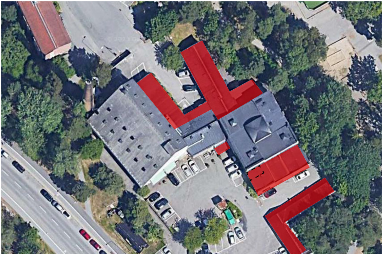
Panncentralen på satellitfoto. Rödmarkerade delar har tillkommit efter uppförandet.