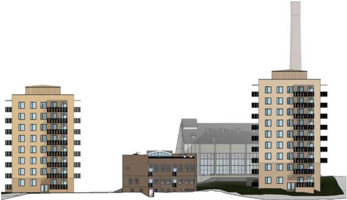
Fasad mot nordost. Notera de nya franska balkongerna på tvätt/verkstadsbyggnaden (hus B) samt det återskapade glaspartiet på panncentralen. Nyréns arkitektkontor.