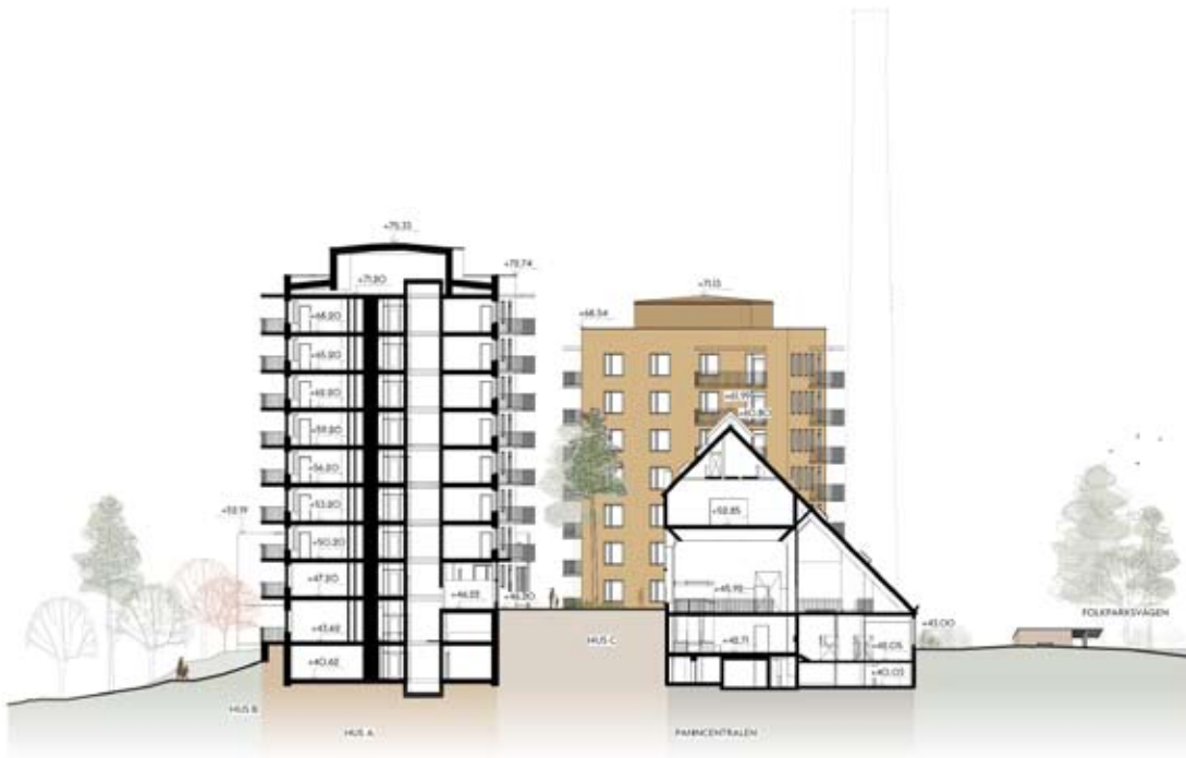
Sektion genom panncentralen och hus A. Nyréns arkitektkontor.