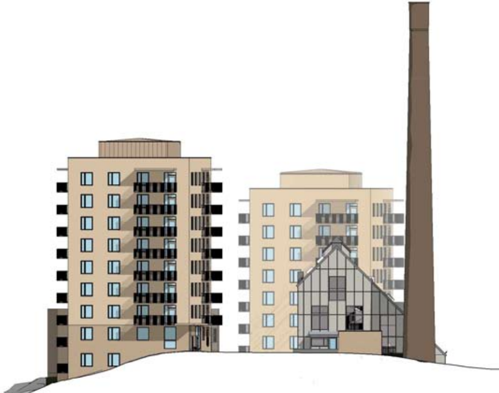
Fasad mot nordväst. Notera de nya fönstren på panncentralens gavel. Dessa redovisaas med varierande utformning i underlaget. Nyréns arkitektkontor.