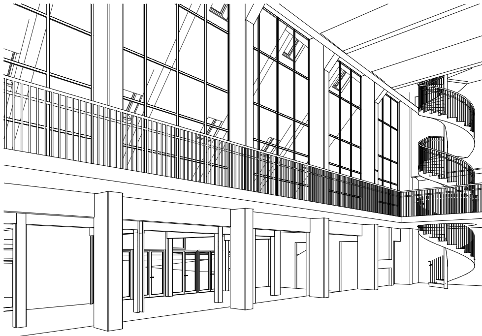
Skissperspektiv från förslaget. Ny interiör i Panncentralen. Nyréns arkitektkontor.