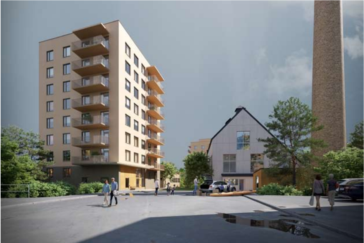
Illustration av planförslaget från Kristallvägen i norr. Till vänster hus A, till höger panncentralen. Nyréns arkitektkontor.