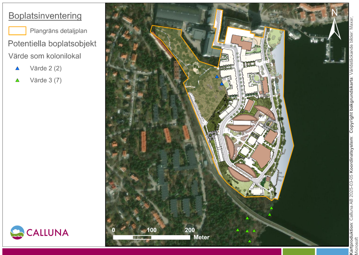
Figur 4. Identifierade potentiella boplatsobjekt under Callunas inventering av området 2021. Samtliga objekt är träd, där två av dem har bedömts hysa goda förutsättningar för fladdermöss (värde 2), medan övriga sju har bedömts hysa begränsade förutsättningar för fladdermöss (värde 3).

Gällande tillgången på boplatsobjekt inom detaljplaneområdet så identifierades under Callunas inventering 2021 totalt nio boplatsobjekt, där två av dem bedömdes ha goda förutsättningar för fladdermöss, medan resterande sju objekt bedömdes ha begränsade förutsättningar. Om planskissen läggs ovanpå en kartbild som visar positionen för de identifierade potentiella boplatsobjekten ser man att inget av dessa objekt träffas direkt av den förändrade markanvändningen (Figur 4).