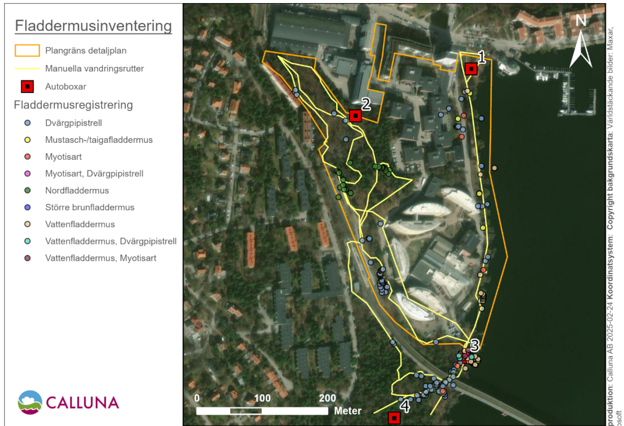
Figur 3. Resultat från fladdermusinventeringen vid Alviks strand år 2021. Autoboxlokaler är markerade med röda kvadrater med svart center. Orange linje avgränsar detaljplaneområdet. Gul linje visar slingan som inventeraren vandrade längs under den manuella inventeringen. Inspelningar av respektive art avgränsas med cirkelar i olika färger, se teckenförklaringen i figuren.

Vid fladdermusinventeringen som genomfördes 2021 av Calluna noterades totalt 7 fladdermusarter: nordfladdermus ( Eptesicus nilssonii ), vattenfladdermus ( Myotis daubentonii ), mustasch-/tajgafladdermus ( M. mystacinus/brandtii ), större brunfladdermus ( Nyctalus noctula ), brunlångöra ( Plecotus auritus ), trollpipistrell ( Pipistrellus nathusii ) samt dvärgpipistrell ( P. pygmaeus ) (figur 3). Arterna mustasch- och tajgafladdermus är svåra att särskilja enbart på ljudet, varför de räknas som ett artkomplex, och det är möjligt att båda arterna finns i området.