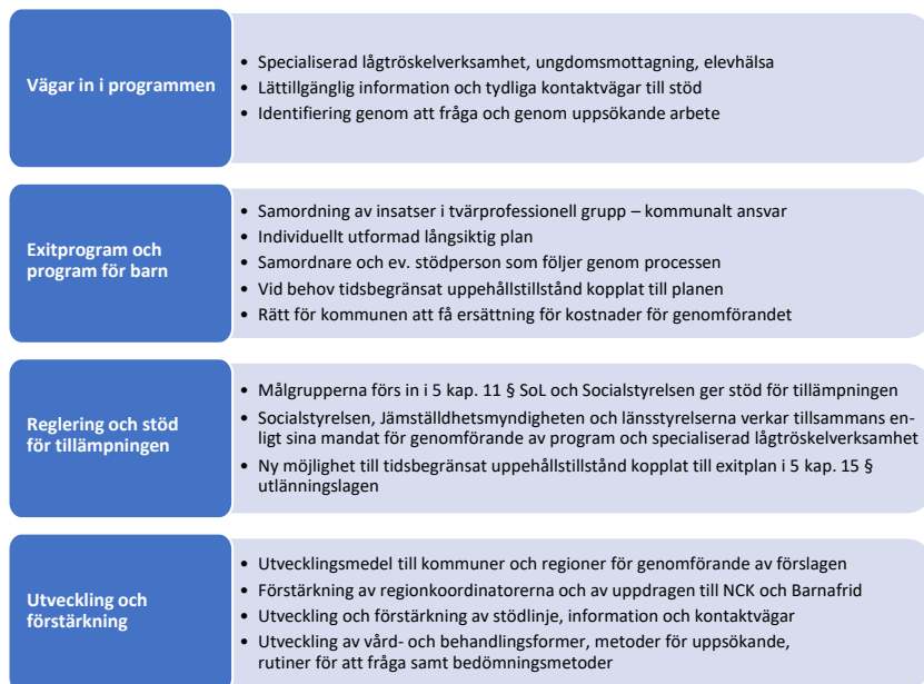
Figur 10.1 Översikt över våra förslag

Våra förslag kan sammanfattas i följande bild.