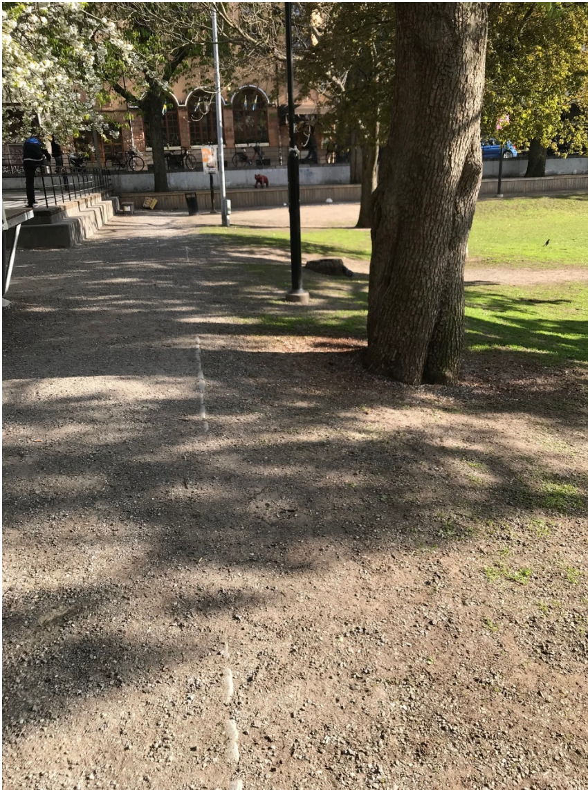
Bild 3. Slitna grusytor