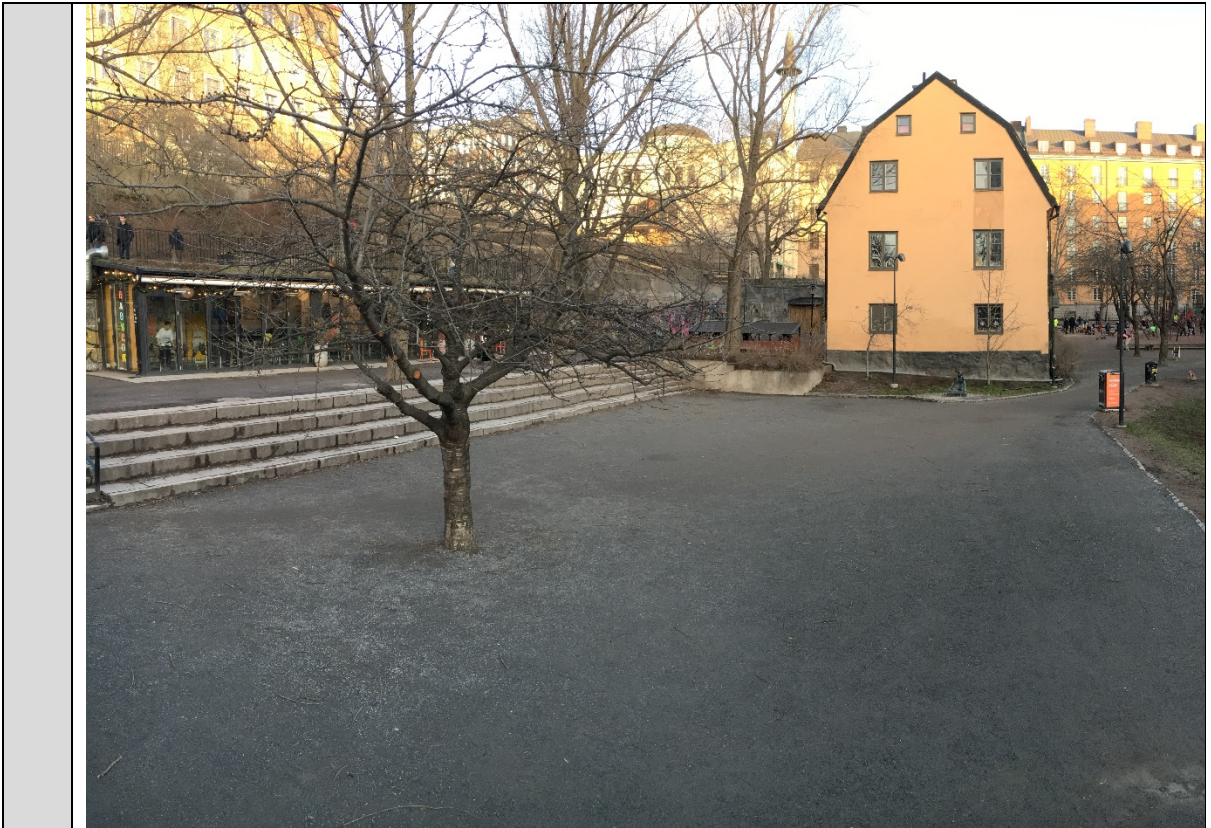
Bild 3. Åtgärdade grusytor