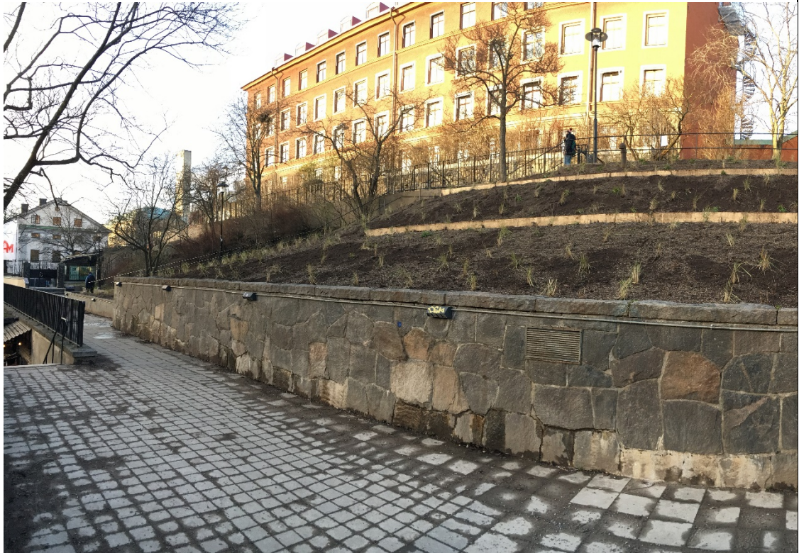
Bild 1, Slänten vid trappan upp mot moskén

Infoga bilder från plats efter trygghetsinvestering.