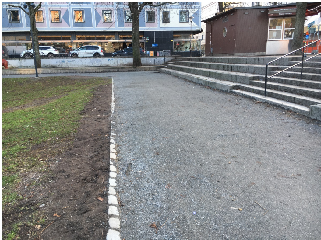
Bild 2. Kantsten vid gräsytan