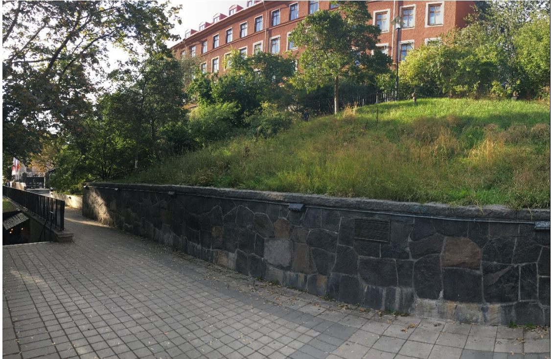
Bild 1. Slänten vid trappan upp mot moskén

Infoga om bilder finns från plats innan trygghetsinvestering.