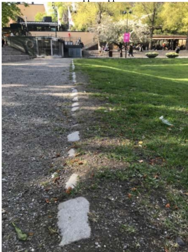
Bild 2. Kantsten vid gräsytan