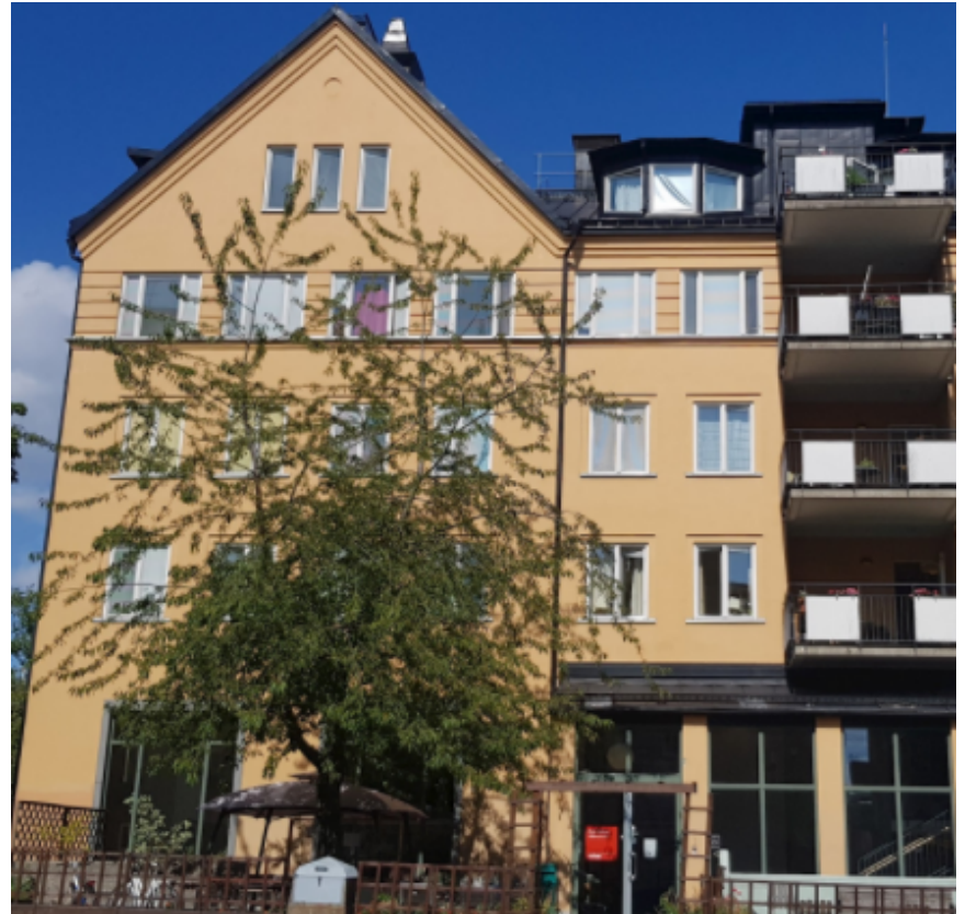
Hornskrokens vård – och omsorgsboende