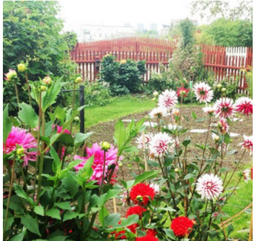
Dagverksamheten Guldägget- Södermalm