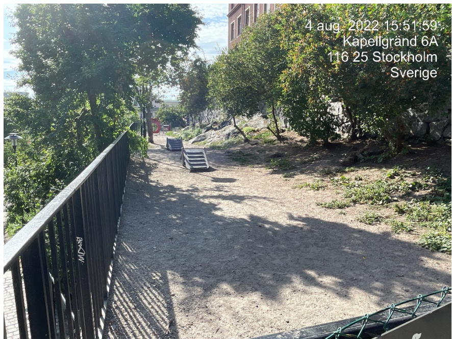
Bild från hundrastgården i Björns trädgård.

Den aktuella muren ansvaras inte av staden utan ligger inom fastigheten Pelarbacken Större 8. Vid besök på platsen kan konstateras att det finns ett antal hål i muren (se bild nedan).