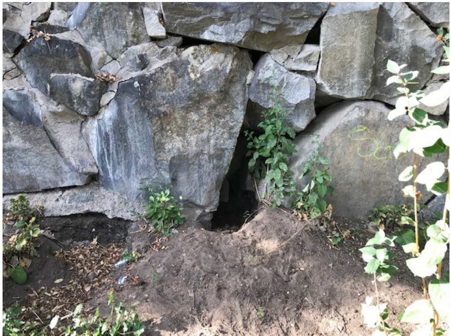
Bild som visar hål i muren vid hundrastgården.

Den aktuella muren ansvaras inte av staden utan ligger inom fastigheten Pelarbacken Större 8. Vid besök på platsen kan konstateras att det finns ett antal hål i muren (se bild nedan).