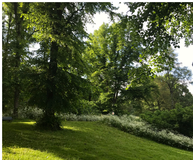
Tantolunden grönska upplevs som natur och skog av många.