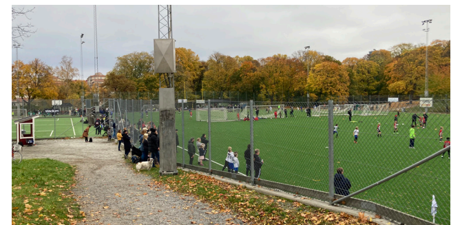
Många besökare i området idag på Reymes höstcup.