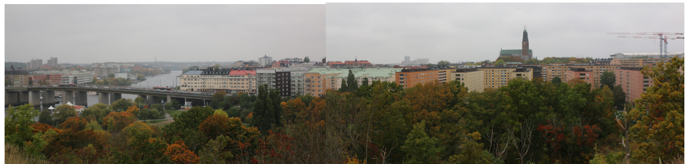
Vändplanen på Tantoberget har utsikt mot Hornstull och Årstaviken. Många upplever den som en återvändsgränd.

andningshål komma bort från bilfritt stressen lugnet tantoberget, ingen som "hets- dold oas cyklar"