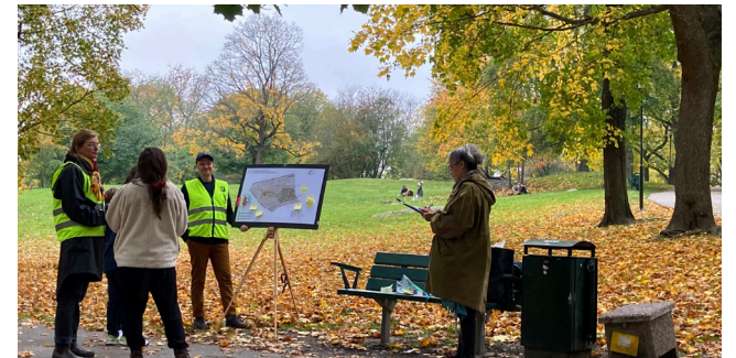
Intervjutillfällen i nära anslutning till lekplatsen, Tågparken.

ÅLDER 0-10 9 11-15 2 16-25 - 26-40 13 41-55 13 56-69 7 70+ 8