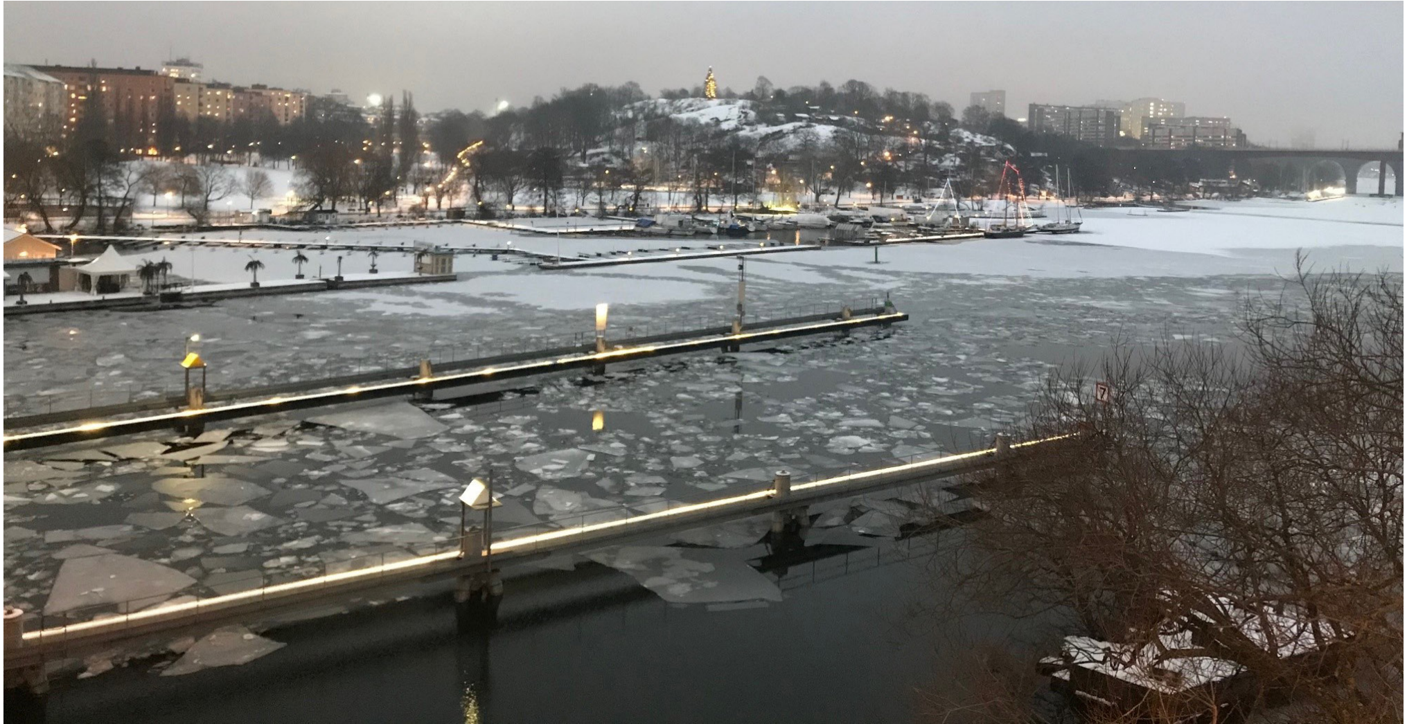
Vintertid stärker julgranen Tantolundens runda siluett och drar ögat till sig från långt håll över vattenrummet. Vissa delar av Tantoberget upplevs otillgängliga. Under dialogtillfället önskade många tillkommande aktivitet på toppen för att dra besökare hit. Nuvarande parkväg från Tanto slingrar sig upp genom koloniområdet, men bilden visar också brantare, oländiga sidor, där kopplingar upp till toppen saknas.