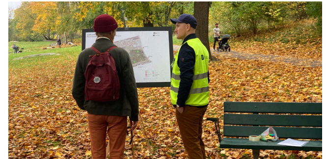
Intervjutillfällen i nära anslutning till lekplatsen, Tågparken.