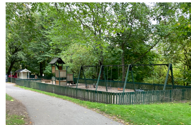
Lekplats i Tantolunden som används mycket av förskoleklasser och boende i Tantolundens närhet.

Man vill samtidigt inte att man bygger i parken så kanske är en tillfällig servering vår-höst något som skulle tillfredställa både de som vill se och inte vill se mer aktivitet på toppen.