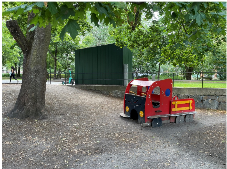
Leklastbilen med den offentliga toaletten i grönt i bakgrunden.

Förvaltningen tackar för förslaget som har till syfte att skapa en mer tydlig parkdisposition där lekytorna hålls koncentrerade till en del av parken och med längre avstånd till den offentliga toaletten.