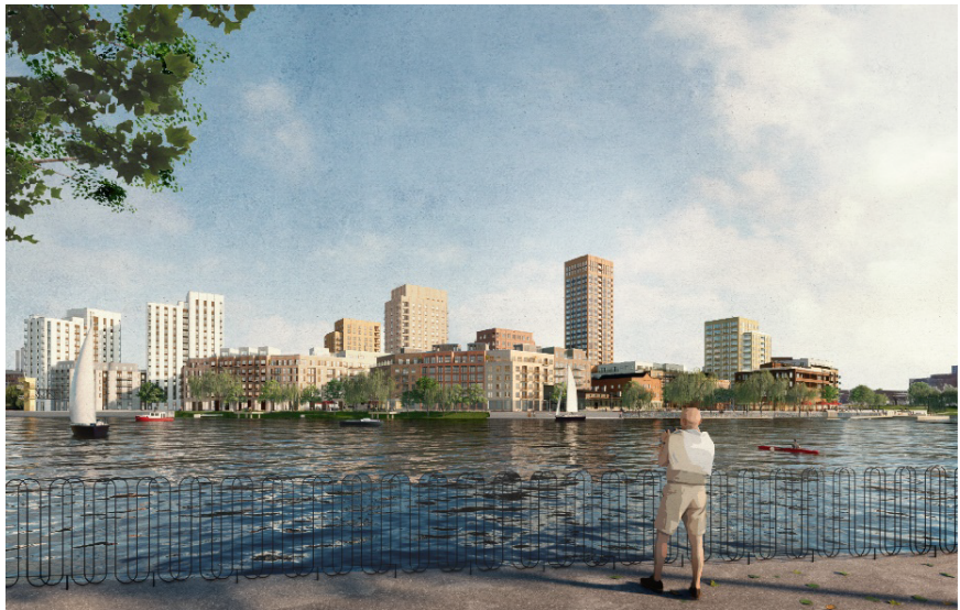
Vy österut från Reimersholme. Bild FOJAB Arkitekter.