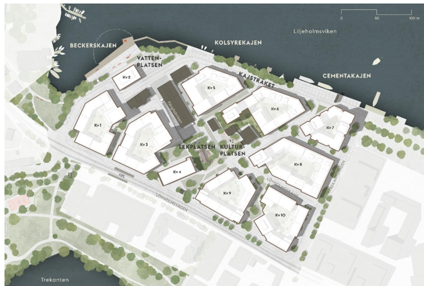
Publika stadsrum/allmänna platser inom Lövholmen. Bild: FOJAB Arkitekter i samarbete med Nivå.