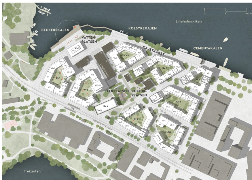
Illustrationsplan Lövholmen. Gråmarkerade byggnader är befintliga som bevaras och de vitmarkerade byggnaderna utgör nya kvarter. Bild: FOJAB Arkitekter.