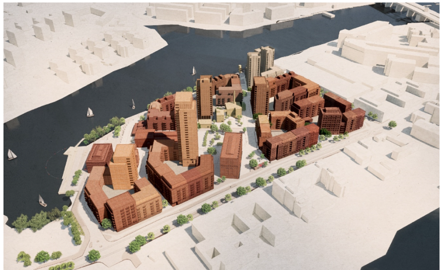
Flygvy från sydväst. Bild: FOJAB Arkitekter.

Stadsstrukturen får en hög bebyggelsetäthet och ett stort antal bostäder tillförs. Kulturhistoriska byggnader ges en framträdande roll i stadsstrukturen som kontrast till den nya bebyggelsen. I bilden nedan visas en illustration på den nya bebyggelsen.