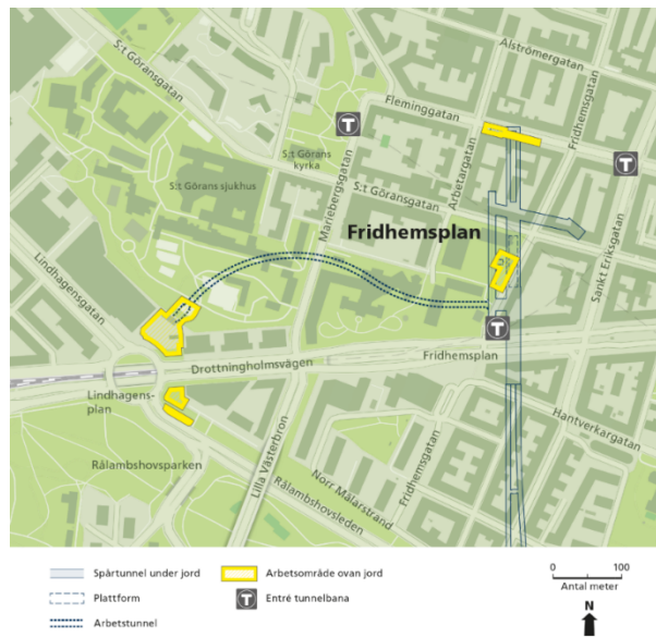
Bild 2: Arbetsområden, arbets- och servicetunnel vid Lindhagensplan

I syfte att optimera investeringskostnad och byggtid har bland annat växelpartier kortats ner och plattformsbredder minskats, spårtunnlar och en del stationer har justerats till mindre djupa lägen, stationernas volymer har minskats, antal hissar har minskats och utrymningskonceptet har förändrats.