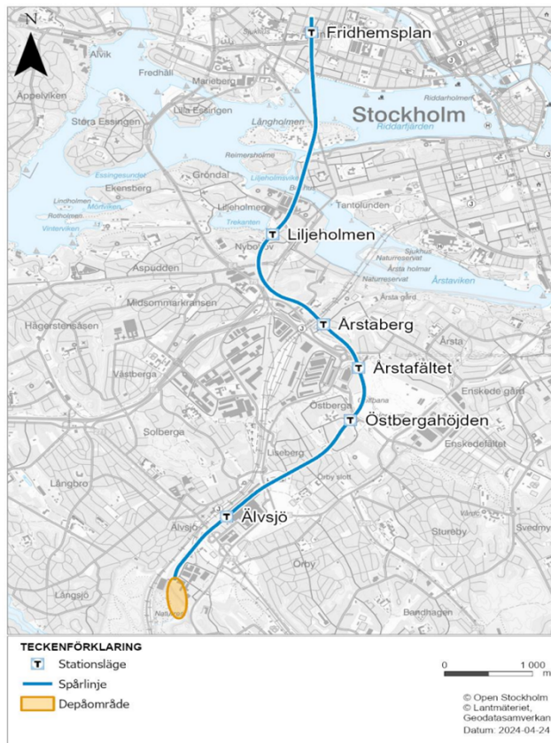
Bild 1: Planerade tunnelbanans sträckning och stationslägen samt ungefärlig placering av depån

10 minuter. Linjen behöver även en ny depå som föreslås ligga i Älvsjö industriområde.