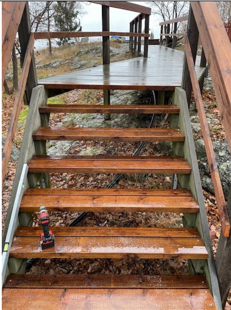
Renoverad trappa vid Tantotoppen.