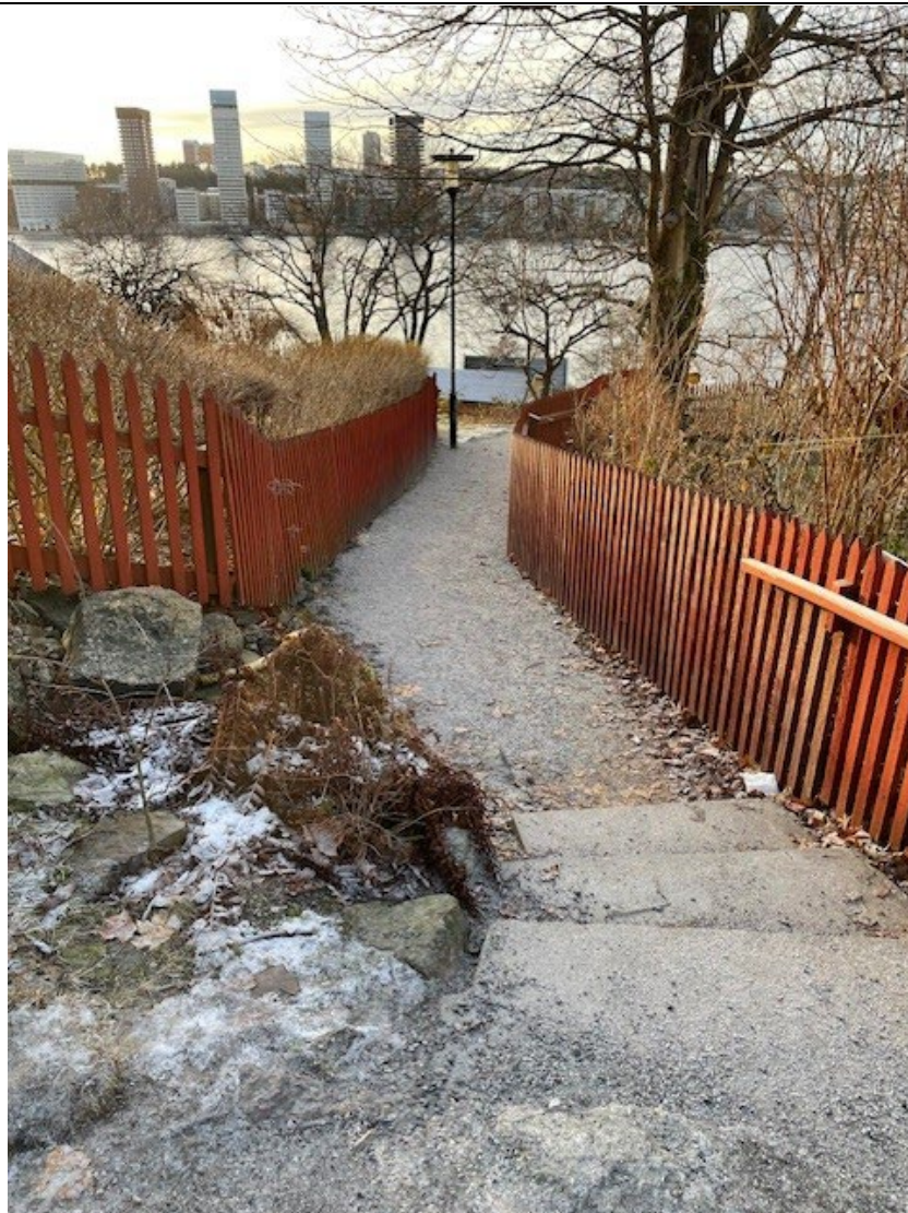
Åtgärdad del av trappförbindelsen mellan Tantotoppen och Drakenbergsparken.