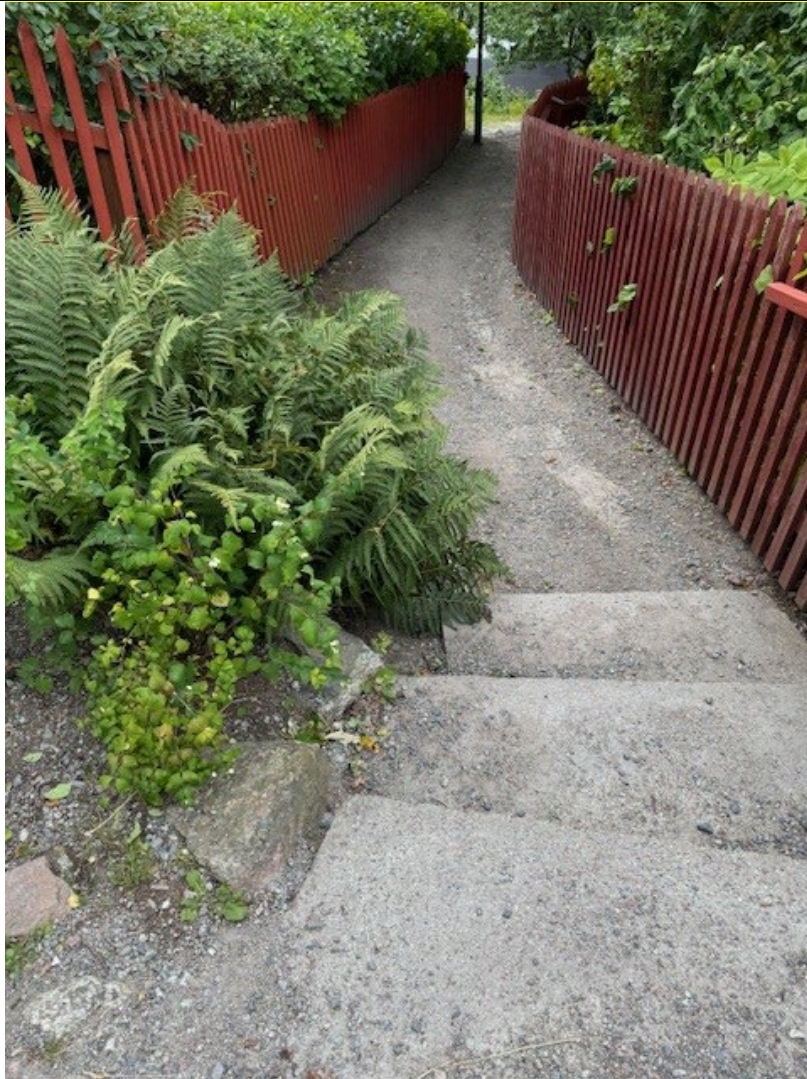
Del av trappförbindelsen mellan Tantotoppen och Drakenbergsparken.