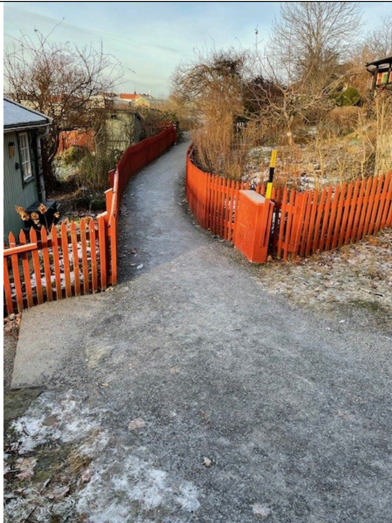
Åtgärdad gångstig genom koloniområdet Södra Tantolunden.