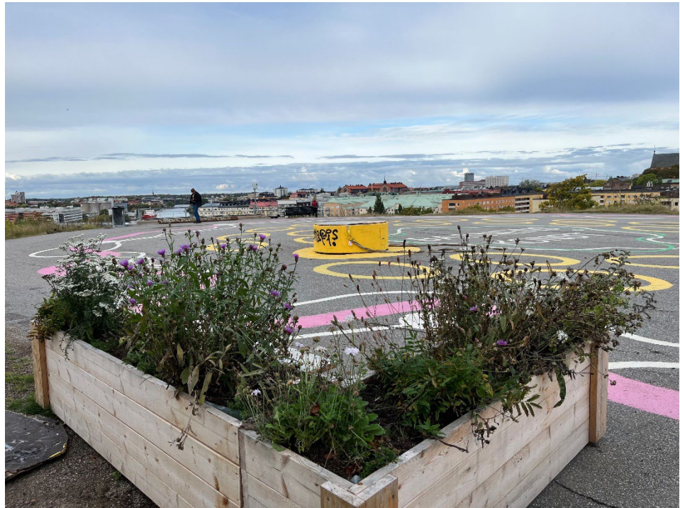
Tantotoppen med markmålningar samt planteringskärl med inbyggda bänkar.