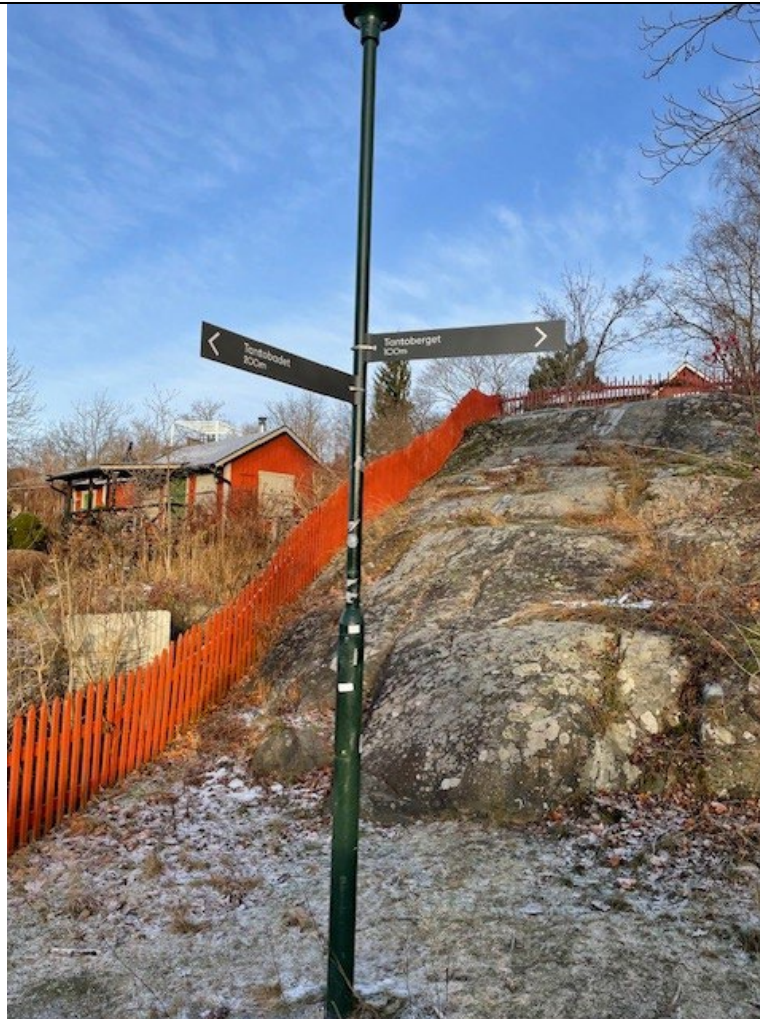
Uppsatta hänvisningsskyltar.