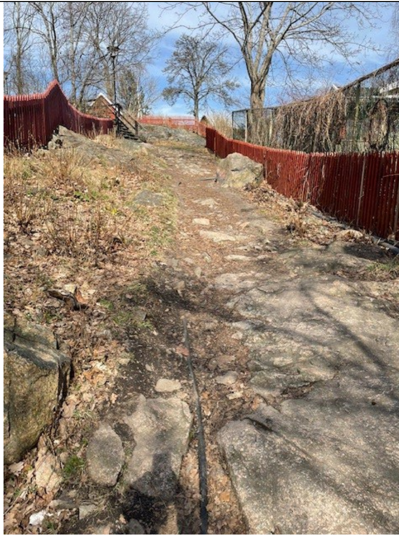
Den övre delen av förbindelsen mellan Tantotoppen och Drakenbergsparken, Anita Pelenius Stig.