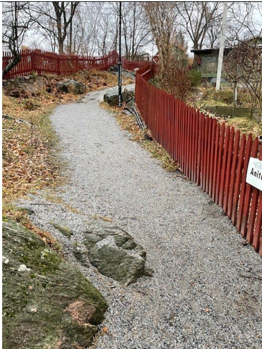
Åtgärdad gångstig, den övre delen av förbindelsen mellan Tantotoppen och Drakenbergsparken, Anita Pelenius Stig.