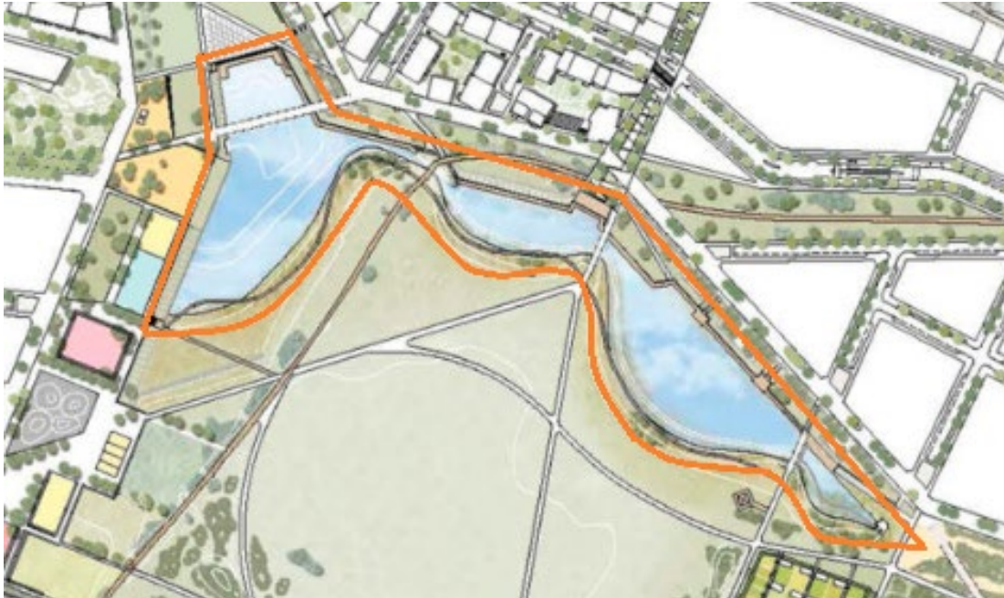
Figur 3. Bild över dammen, orangemarkerat.