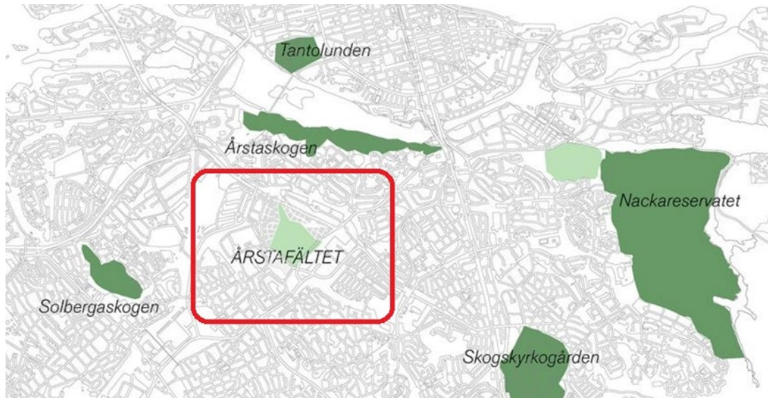
Figur 1. Projektets lokalisering i Stockholm, rödmarkerat.

Exploateringen på Årstafältet är planerad att utföras i 8 etapper, genom ett flertal detaljplaner. Stockholms stad har valt att samordna vissa av etapperna och genomföra en gemensam groventreprenad i vilken ingår bland annat att förstärka marken för att möjliggöra byggnation av gator och ledningar, anläggande av gator och VA för kommande bostäder. Stockholm Vatten och Avfall kommer att följa stadens planerade etappindelning, med undantag av den första etappen av exploateringen, där anpassningar mot befintligt ledningssystem behöver göras.