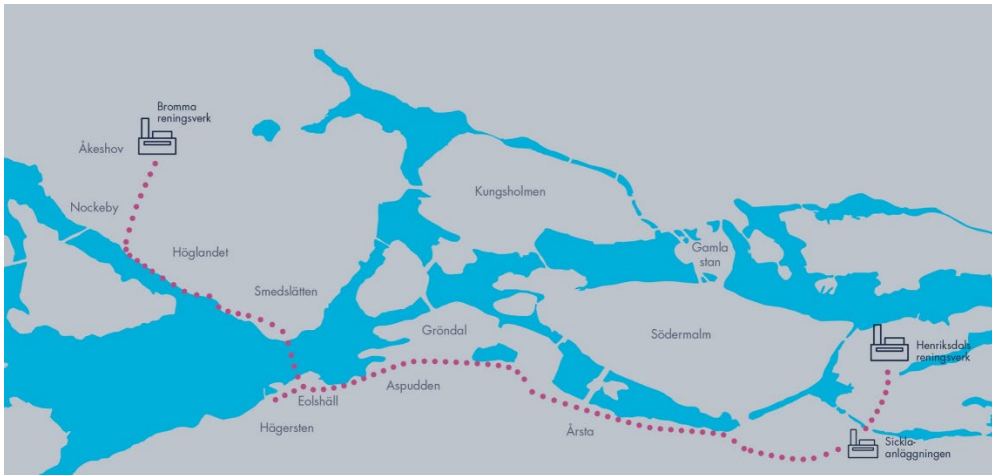
Den nya tunneln mellan Bromma och Sickla

Tunneln har en total sträckning på 14 km, se bild, och ligger på ett djup som går från -27 meter i anslutning till Bromma reningsverket till -46 m i anslutning till Sicklaanläggningen, undantaget i passagen under Mälaren där tunneln ligger på drygt 90 meters djup.