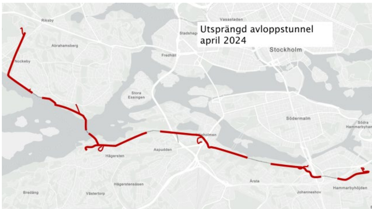
1 Framdriftskarta för Tunneln, röd linje markerar färdigsprängd tunnel.