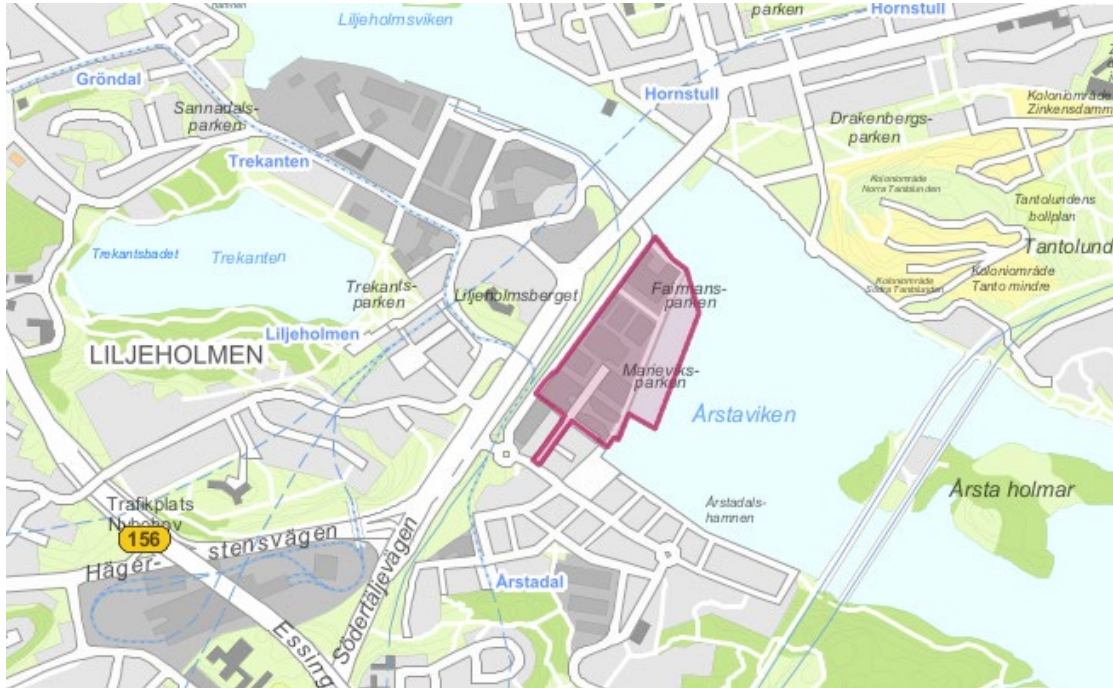
Figur 1. Planområdet för Marievik.

Totalt sett bedöms exploateringen kräva cirka 3000 meter nyläggning av vatten-, spill- och dagvattenledningar. Dessutom kommer avloppspumpstationen Mejerivägen att behövas dimensioneras upp för att klara den ökade belastningen.