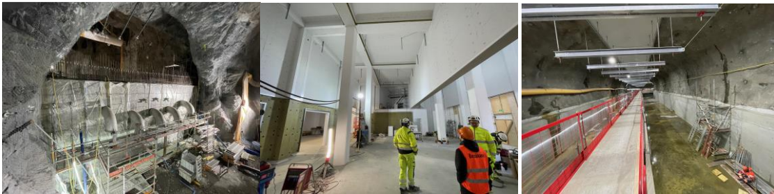
Sickla mars 2025. Från vänster till höger: Bromma PST/Teknikhuset/Försedimenteringsbassäng

I Sickla pågår betongarbeten för försedimenteringsbassänger och pumpstationen. Vi har nyligen gjutit 50% av all betong. Byggnadsarbeten och installationer pågår även i den nya teknikbyggnaden utanför bergutrymmet. Kritisk tidslinje för Sicklas arbeten är påverkat av den försenade bergentreprenaden som styr när Bromma kan kopplas in.