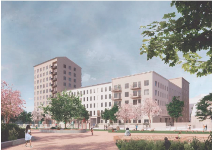
Fasadperspektiv mot öster

Projektet har en relativ bred lägenhetssammansättning. AB Stockholmshem planerar för en fördelning av lägenhetsstorlekar från två till fem rum och kök, och tyngdpunkten ligger på två- och trerumslägenheter.