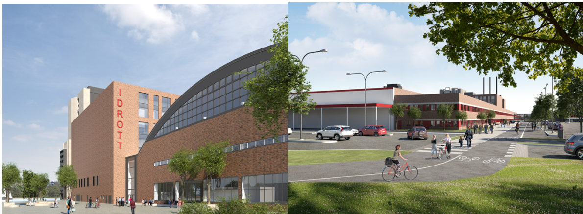
Visionsbilder på norra sekundära entrén till idrottsanläggningen samt gång och cykelstråket längs södra fasaden, Brunnberg & Forshed arkitekter

Det föravtal som tecknats har gått ut då exploateringsavtal inte är tecknat inom föreskriven tid och inte heller avses tecknas mot bakgrund av att planarbetet nu har en ny inriktning jmf med det planförslag som avtalet avsåg. Exploateringskontoret önskar därför teckna nytt föravtal. Bolaget avser återkomma till styrelsen med ett förslag till föravtal när detta är slutförhandlat.