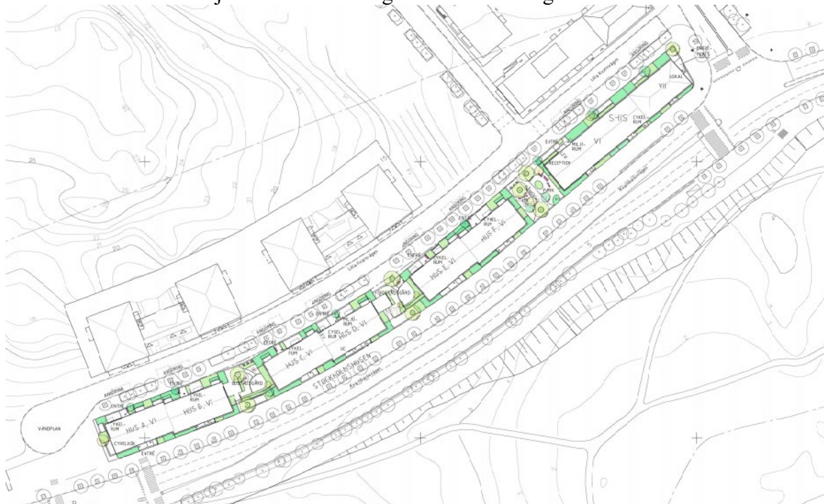
Situationsplan som visar kvarter 1a och 1b.

Husen bildar en front till de nya stadskvarteren och är detaljplaneområdets södra gräns och blickar ut över Lillsjön i söder och skogskullen och lokalgatan i norr.