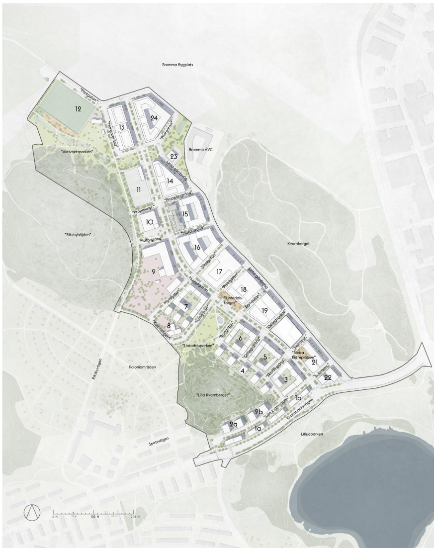
Skiss över kvartersindelning för den nya stadsdelen. Stockholmskvarter benämns 1a och b.