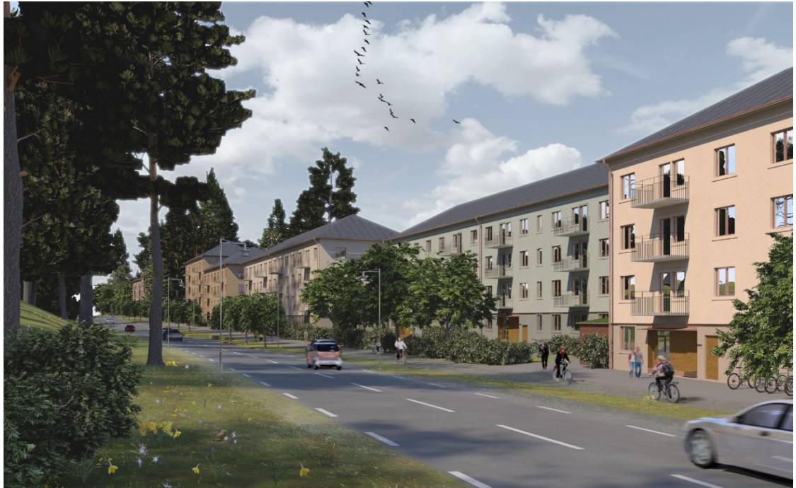
Perspektiv bild från Växthusvägen.

Fasaderna putsas med markerade sockelvåningar och omfattningar kring fönster. Fasadkulörer utgår från Stockholmshusens kulörpalett med dämpade putskulörer och bruna fönstersnickerier. Byggnadselement som entréer, balkonger och takfot utformas med den höga ambitionsnivå som är kännetecknande för Stockholmshusen.