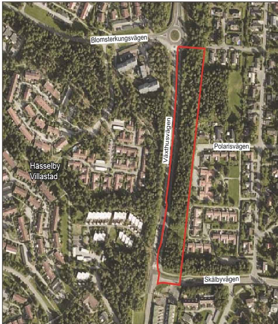
Lokalisering karta med planområdet.