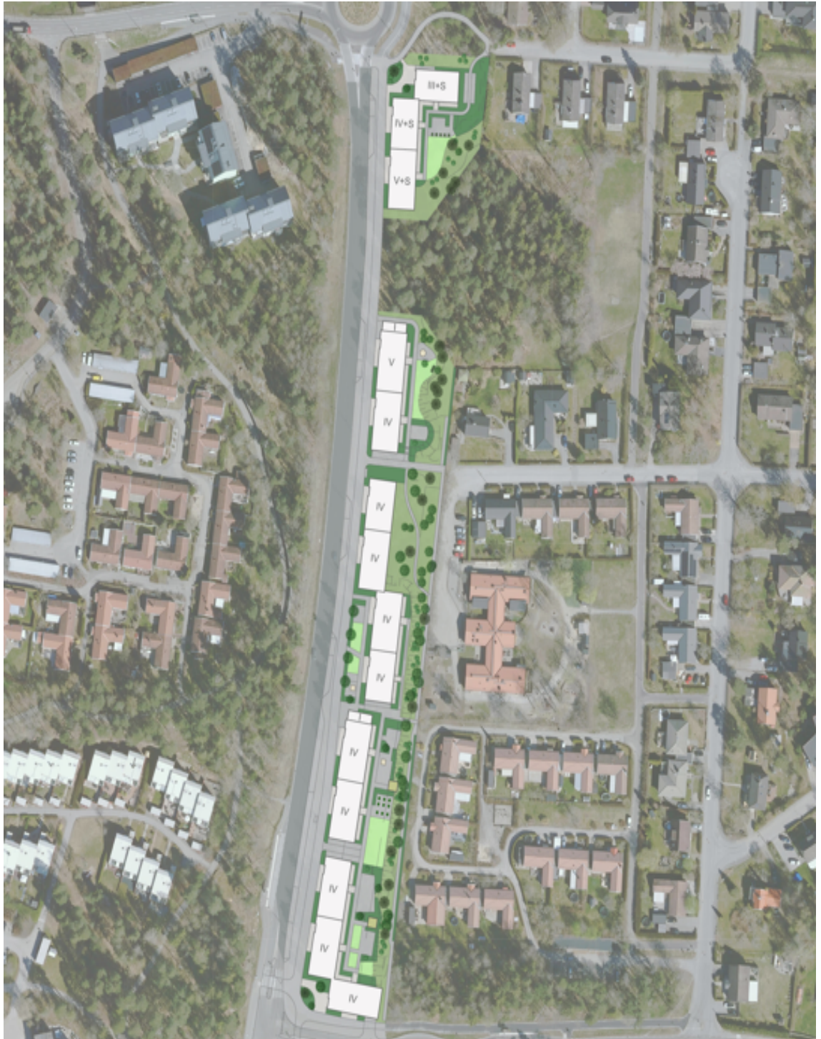
Illustrationsplan över planförslaget