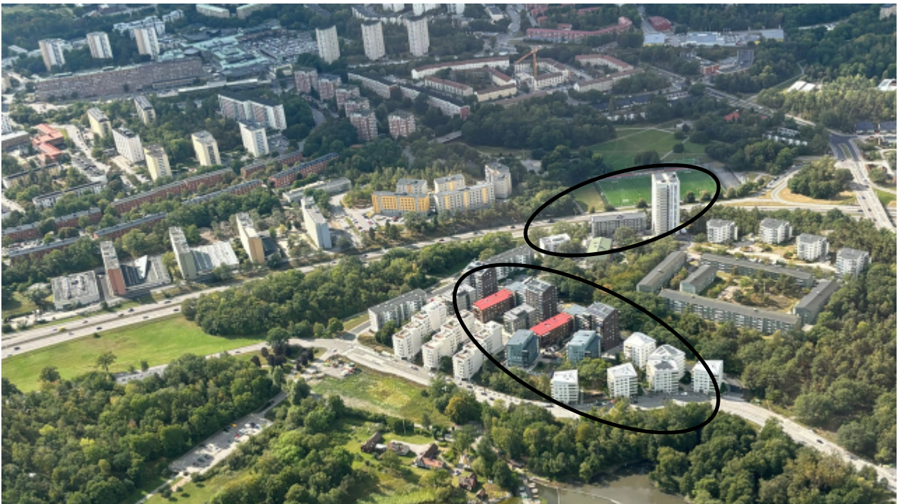
Flygfoto över kv. Drevvikshöjden med Farsta i bakgrunden.