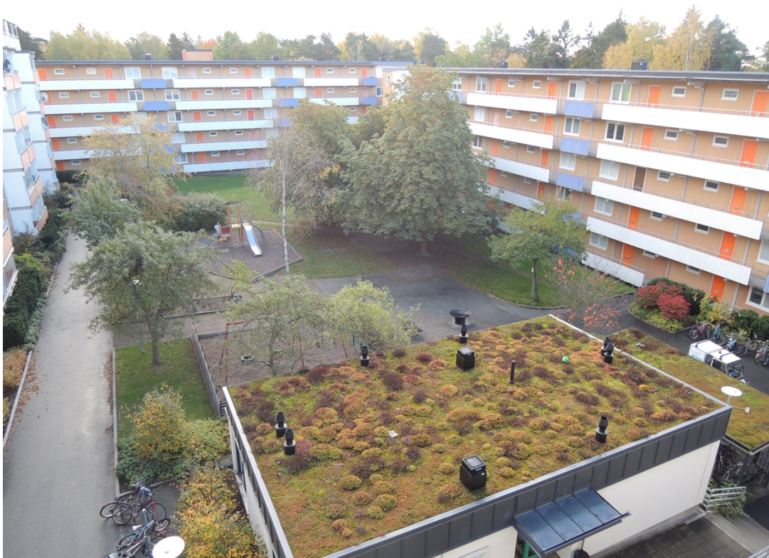
Bild 2. Vy över fastighetens innergård.