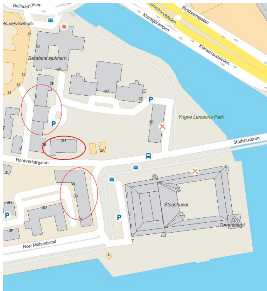
Utdrag från hitta.se

sin tekniska livslängd och nu är i akut behov att åtgärdas. Vid denna undersökning konstaterades att ytterligare tekniska installationer, så som ventilation, el och brand också uppnått sin tekniska livslängd och att en total renovering var nödvändig.