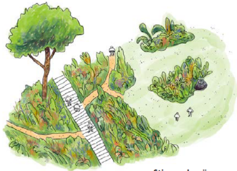
Stigar och spänger