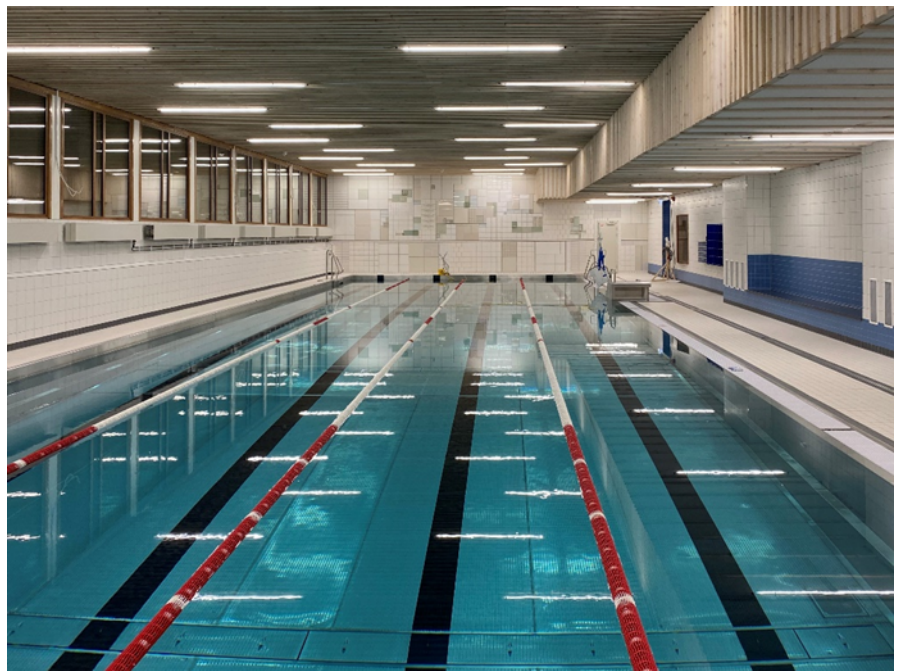
Nyrenoverad simhall med en ny rostfri simbassäng och konstverk av keramiska plattor och glasprismor i bakgrunden.

Projektet är genomfört enligt stadens projektmodell för projekt under 50 mnkr. Fastighetsnämnden är projektägare och fastighetskontoret ansvarar för projektleveranser och koordinering med berörda förvaltningar. Projektet genomförs i samarbete med idrottsförvaltningen i egenskap av hyresgäst och verksamhetsutövare. Idrottsförvaltningen har följt projektet kontinuerligt och bland annat ansvarat för kontakter med föreningsliv samt avtalsdiskussioner med andrahandshyresgäster.