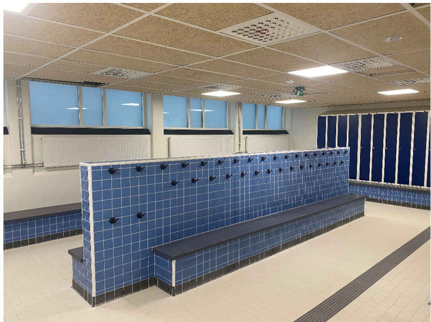
Nyrenoverade omklädningsrum med ledstråk för synskadade.