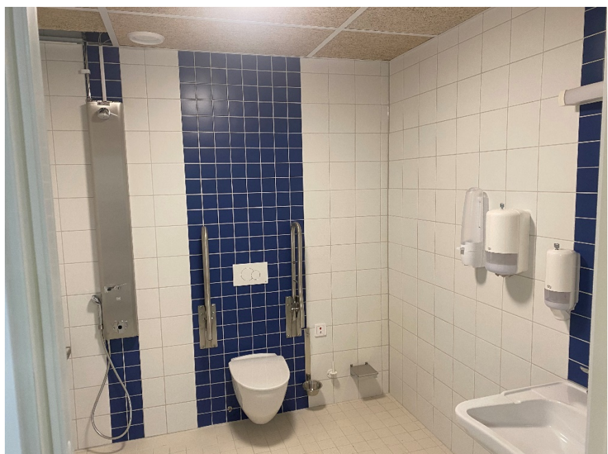
Flertalet nya toaletter som är anpassade för rörelsehindrade.