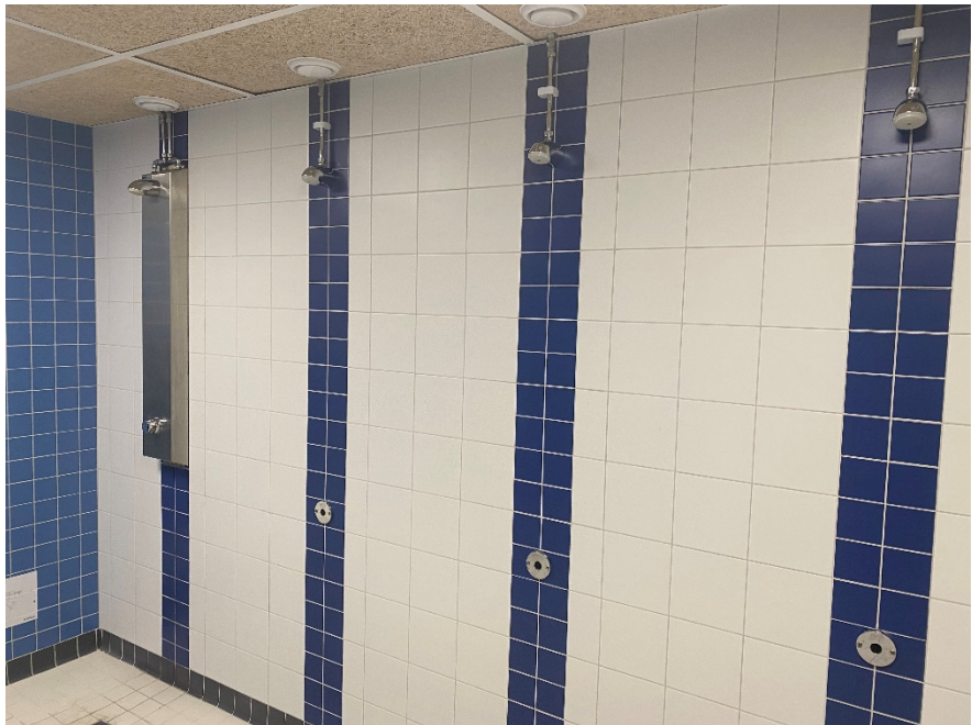
Nyrenoverade duschar.