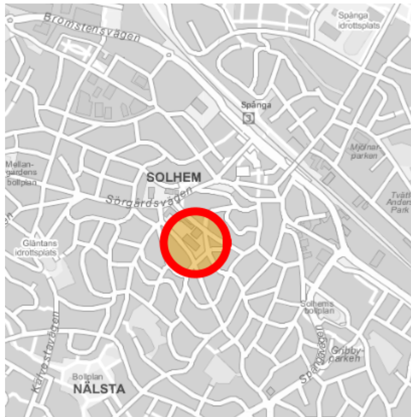
Spångahallen/Spångabadet ligger i Solhem.