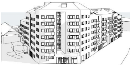
VY FRÅN NORDVÄST