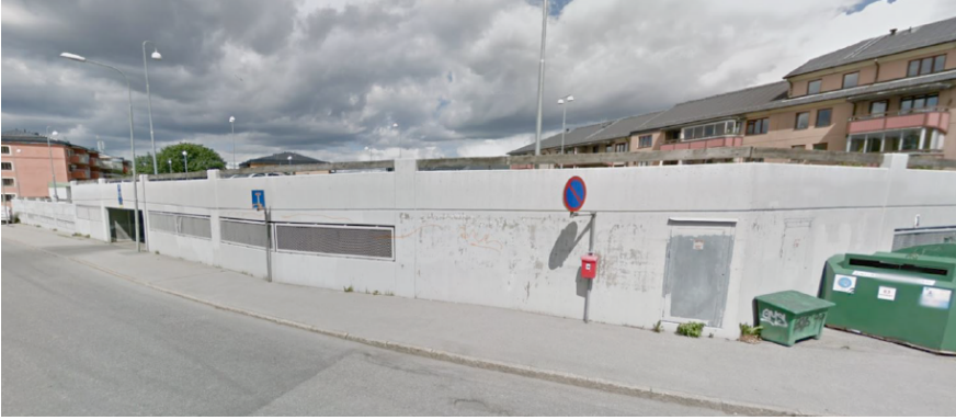
Befintligt parkeringsdäck som rivs för att möjliggöra projektet