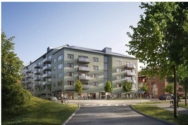
Gestaltningssbild med vy från Kyrkogårdsvägen

Parkering för blivande hyresgäster kommer förläggas i garage inom bostadskvarteret. Projektet planerar också för mobilitetsåtgärder, som till exempel cykelrum, plats för lådcykelpool och för bilpool.