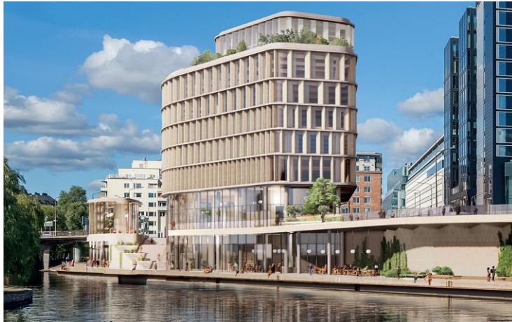
Visionsbild, Klara City View sett från Klara Sjö.