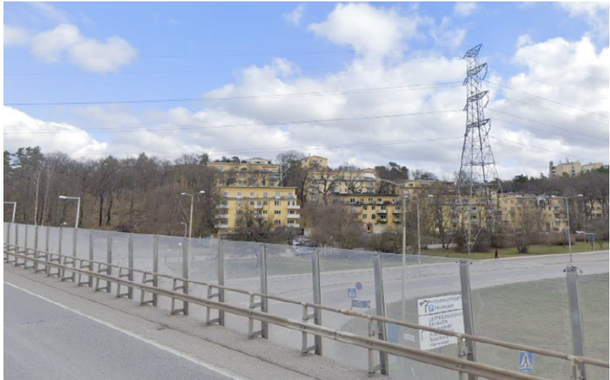
Stolpe nr 544 vid Bergiusvägen och bostadsområdet Ekhagen. Stolpen kommer ersättas av två kabeländstolpar närmare Norrtäljevägen.

När fundamenten har gjutits kommer samtliga gropar att fyllas igen. Därefter monteras stolparna på marken och förs upp med kranar på respektive fundament. Markkablarna kommer därefter att anslutas till ändstolparna. Nya faslinor kommer att dras längs sträckan och kopplas till kabeländstolparna. Det sker genom att faslinorna läggs över i så kallade linvagnar som monteras på isolatorkedjorna. De gamla linorna används därefter som draglina för att dra ut nya högtemperasturlinor. Arbetet med att dra linor över Norrtäljevägen kommer utföras nattetid när det är mindre trafik. Totalt bedöms detta arbete pågå under sju nätter. När samtliga faslinor är på plats och ihopkopplade med markkablarna kan ledningen driftsättas.