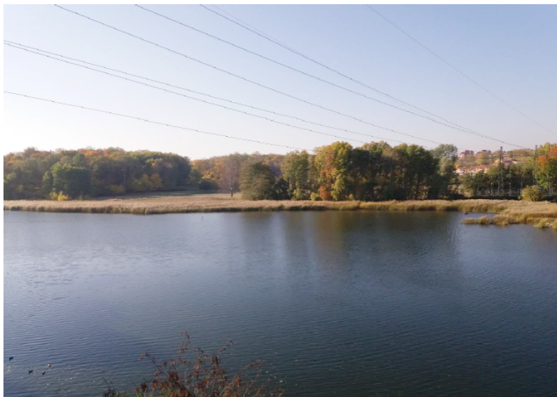
Befintlig luftledning över Brunnsviken februari 2020.

kostnadsberäkningar under 2019, har konstaterat att den ansökta lösningen inte är lämplig. Det beror dels på stor påverkan på naturmiljön till följd av avverkning av ett större antal träd än tidigare förutsatt antal träd inom Nationalstadsparken och höga kostnader till följd av tekniskt komplicerade lösningar. Därtill har ägandeskapet av gång- och strukturbron, som skulle gå över Ålkistan och förbinda Solna och Stockholm och där markablarna skulle byggas in inte lösts, vilket var en förutsättning för sträckningens genomförande.