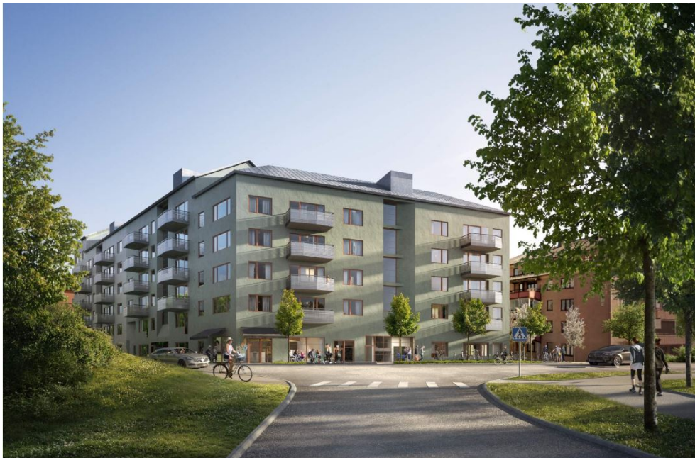
Bild 3. Vy från Kyrkogårdssvägen.

Byggnaden kommer att putsas i gröna nyanser och ha en sockel av natursten eller sockelputs i avvikande kulör. Taket bekläs troligen med plåt samt solceller och solfångare. Innergården är helt underbyggd av garage, det kommer finnas planteringar, uteplatser och eventuellt en lektyta på gården, se Bild 3-4.