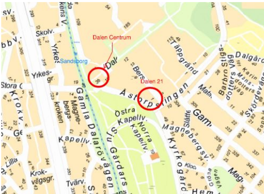
Bild 1. Dalen 21 nära Dalen Centrum och tunnelbanestation Sandsborg.

Projektet avser fastigheten Dalen 21 som ligger nära Dalen Centrum, söder om Stockholms innerstad. Närmsta tunnelbanestation är Sandsborg som ligger längst gröna linjen, se Bild 1. Svenska Bostäder äger Dalens centrum och har ett distriktskontor lokaliserat i Dalens centrum.