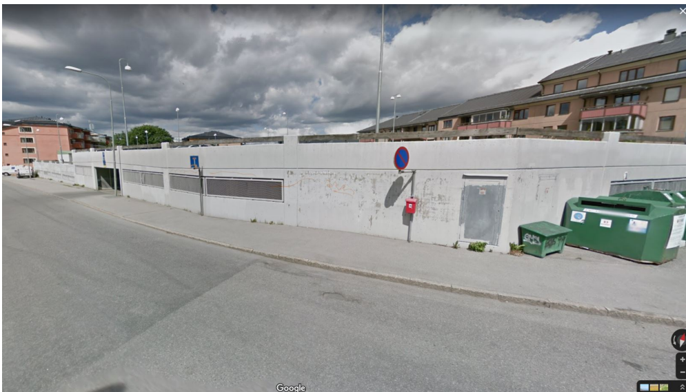
Bild 5. Gatuvy från Åstorpsringen befintlig situation.

Genom satsningen Rättvist Byggnad arbetar vi för att motverka ekonomisk brottslighet, svartarbete och oegentligheter på byggarbetsplatser. Vi samarbetar också med organisationen Håll Nollan för att minska antalet arbetsplatsolyckor.